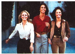
La série originale de 1976

Genre « spécifiquement télévisuel », la série a toujours entretenu des rapports étroits avec le cinéma. Echanges de bons procédés entre le grand et le petit écran. Par Mathieu Loewer