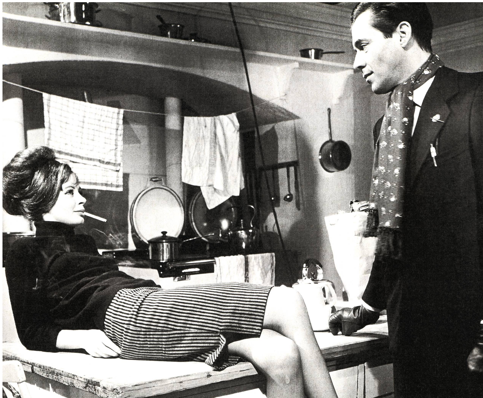
Sarah Miles et Dirk Bogarde dans «The Servant» de Joseph Losey

l'exemple» («King and Country», lugubre plaidoyer contre la guerre) peuvent faire figure de point de rupture. Pour certains, c'est là la triste fin d'un cinéaste, pour d'autres au contraire, la naissance d'un auteur à l'égal de Visconti, Antonioni ou Bergman. Harold Pinter, le jeune scénariste qui marque «The Servant» de son empreinte, et Dirk Bogarde, l'élégant comédien et homosexuel à peine caché, seraient-ils les mauvais génies de Losey ou auraient-ils au contraire agi comme des révélateurs?