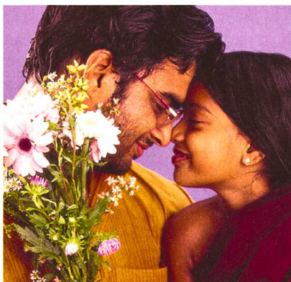
«Un bisou sur la joue» de l'Indien Mani Ratnam

Ouvrez n'importe quelle encyclopédie prétendument spécialisée. À coup sûr, un expert y assénera que la comédie musicale est avant tout une affaire américaine, reléguant en fin de rubrique les malheureux avatars que ce genre cinématographique a pu revêtir sous d'autres latitudes. La rétrospective conçue par Martin Girod, responsable du Filmposium de Zurich, fait un heureux sort à cette vision réductrice qu'il n'est pas bien difficile de battre en brèche. Il suffit d'arguer du fait, indubitable, que le seul pays au monde où la comédie musicale reste encore à l'heure actuelle un genre des plus vivaces est... l'Inde! En octobre 1927, «Le chanteur de jazz» («The