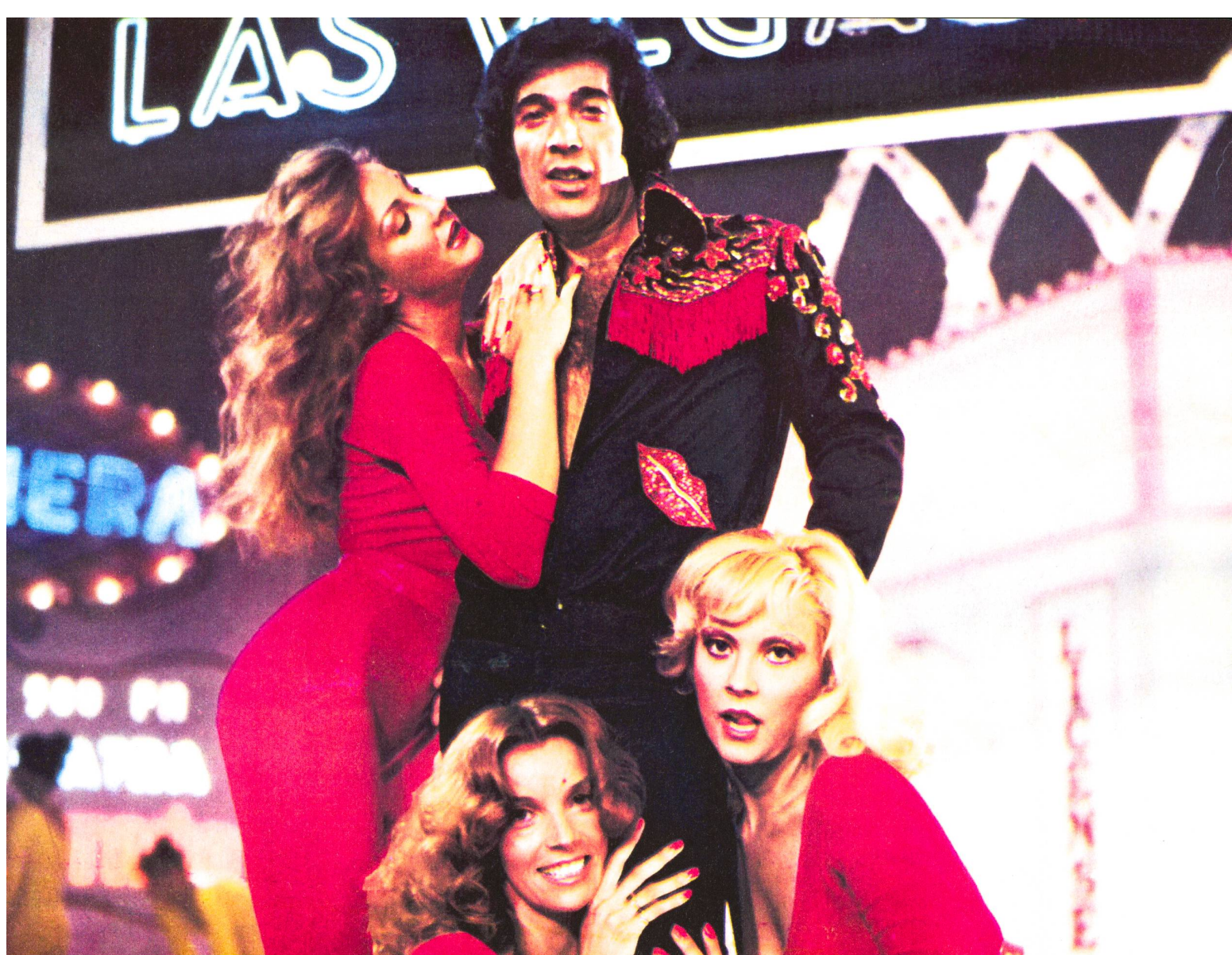
«La plage de l'amour» de l'Argentin Adolfo Aristarain