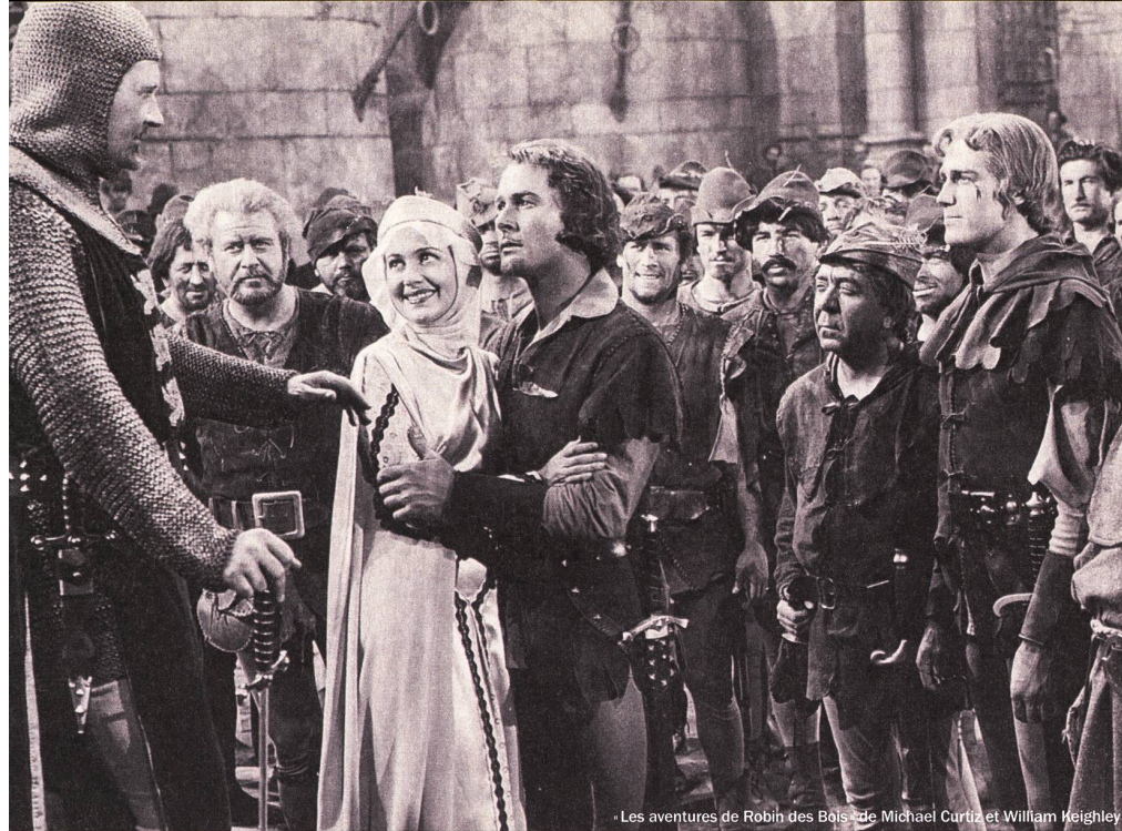
« Les aventures de Robin des Bois » de Michael Curtiz et William Keighley