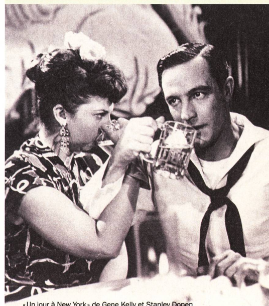
« Un jour à New York » de Gene Kelly et Stanley Donen

« Un Américain à Paris », « Le pirate », « Brigadoon », « Living in a Big Way », « Un jour à New York », « Beau fixe sur New York », « Chantons sous la pluie », « Les Girls ». TCM, deux films tous les vendredis d'avril dès 20 h 45.