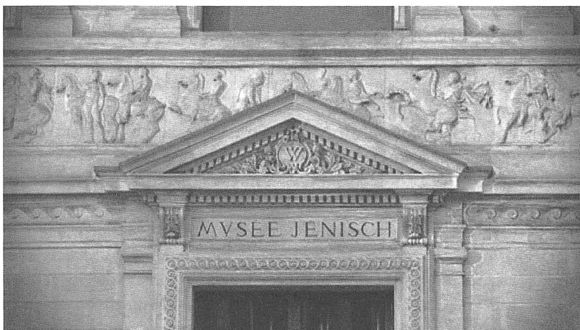
« le musée vous appartient »