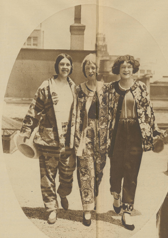
Drei lustige Girls in originalen Plüsch