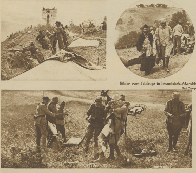
Bilder vom Feldzuge in Französisch-Marokko.