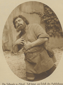
Die Teilspeck in Albuf. Teil links am Erlaß des Apfelschusses. Rechts: das neue Teilspeckhaus.