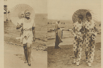
Charmante Strandtänzer in einem Ostseebade