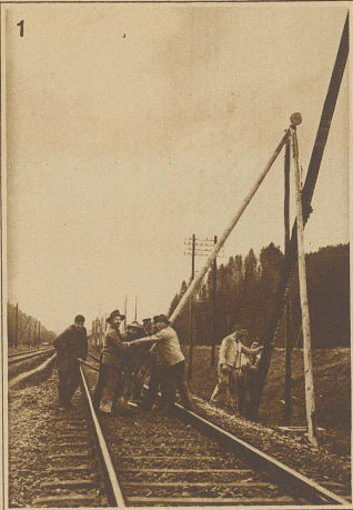
irische Unternehmungen, zur Verfügung gestellten Artikel.

legt und am reglierten Tragsseil aufgehängt. Hier wird der Bobinenwagen ebenfalls benutzt und Bild 6 zeigt uns deutlich, wie sich der Draht abrollt und durch die zwei Mann auf dem Plattwagen am Drahtseil vermittelt der Hängedrähte aufgehängt wird. Bild 7 veranschaulicht die ermüdende Arbeit des Aufhängens. Während der eine Monteur den Hängedraht nach unten zieht, besorgt der zweite das Heben des Kupferdrahtes und das Befestigen am Hängedraht. Der dritte Mann steht als Reserve einige Meter nach und