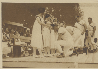
Preisverteilung am Eidgenössischen Turnfest in Crefé.