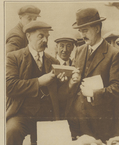
Russische Millionen für England. Kürzlich trafen in London russische Goldbarren im Werte von über 25 Millionen Franken ein. Besondere bei der Prüfung des Goldes.