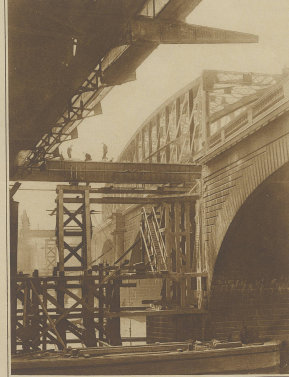
Wander der Technik. Das Bild zeigt die Vorbereitungen zur Ersetzung der alten Wasserwerke in London durch eine neue. Das Einschleppen erfolgte während der Nacht unter kaum bemerkbarem Verkehr. Bilder links obenstehend: Die Eröffnung der besten Ozeanfahrt. Erstes Bild: Parade eines erlesenen Schützenregiments vor dem Abzug. Zweites Bild: Vorparade einer internationalen Musikkapelle. Die Trommler mit ihren typischen Paartreffeln.