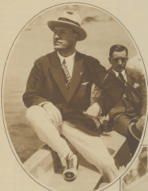
Massenzug in der Sommerfrische. Der umherziehende Klubverkehr in Italien, der außer der Ministerpräsidentenschaft noch vier weitere Ministerien umfasst, findet keine Zeit zu Ferien und begnügt sich mit kurzen Erholungen des Sonntags ober am Meer. Das Bild zeigt Mussolini auf seiner Segeltour im Seebad Nettuno.