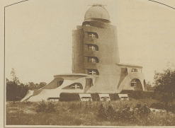
Die Eisenbau-Tempel im Betrieb. Der einem Panzerstahl nicht unähnlich stehende aufgestülpte Bau dient nun zum Studium der bekanntesten Relativitäts-Theorie.