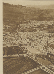
Auf dem Schauspiel einer Entscheidung von weltwelter Bedeutung. Fez, die Hauptstadt von Französisch-Marokko ist von den Rik-Kabylen ernstlich bedroht.