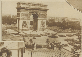
Untenstehendes Bild: Blick auf die Place de l'Étoile in Paris mit dem gleichnamigen Triumphbogen während einer großen Truppenparade. In der Mitte unten dem Bogen schließt sich das Giebel der unbedeckten Soldaten.