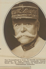
Portrait of a man with a mustache.