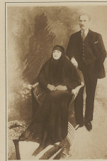
A group of people, possibly a family.