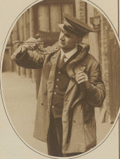
A man in a military uniform saluting.