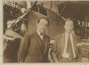
Die beiden französischen Fleger Arradon und Caen vor dem Aufstieg zum großen Fluss...