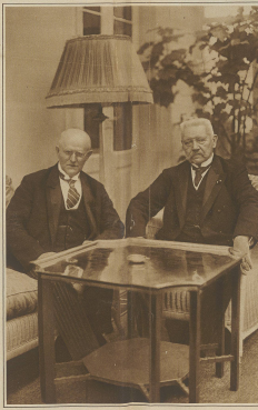
Zwei deutsche Reichstagsabgeordnete in München...