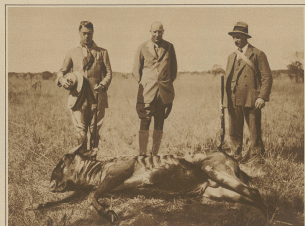
Der englische Koenig (links im Bild) auf der Jagd in Afrika.