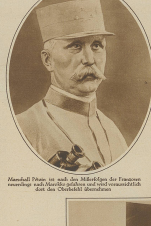
Portrait of a man in a military uniform.