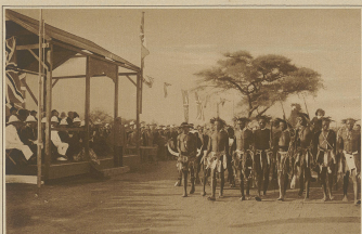
Ada feilich geschnittene Eingeborene von Isoboko, die ihren mit Ochsengezogenen vor dem Feigen von Wales