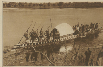
Die Staatsbarke des Häuptlings Yeta von Nord-Rhodesien auf dem Zambezi