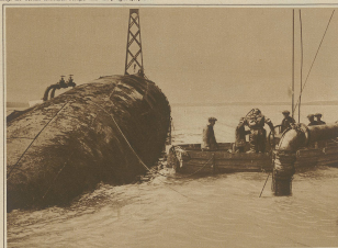
Hebung des während des Kriegs versenkten Schiffes 'Clatten' im Hafen von Dover