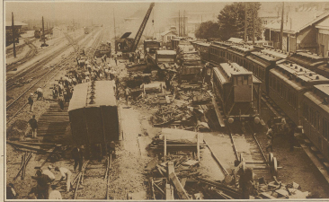
Bild vom großen Eisenbahnviadukt in Amiens, dem wiederum 12 Menschenleben zum Opfer fielen. Als Ursache wird einseitig die verminderte Fahrgeschwindigkeit angegeben, die 118 km betragen haben soll