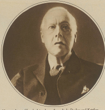
Portrait of a man in a suit.