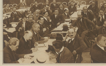
Kongress der französischen Sozialisten in Paris...