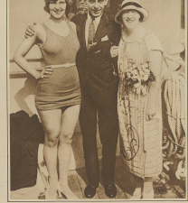
A group of people in formal attire.