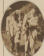
Two men in suits standing together.