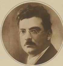
Portrait of a man with glasses and a mustache.