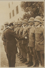
A group of men in military uniforms.