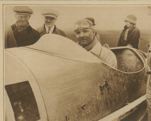
Driver einer der bekanntesten französischen Rennfahrer, siegte in seiner Kategorie in 17 Min. 45/5 Sek.