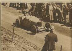
Laport auf Bugatti im Ziel