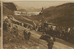
Koudé auf Bugatti im Ziel