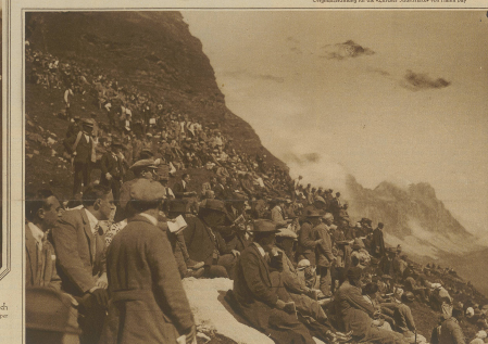
Die dichtgedrängte Zuschauermenge auf einem Felskopf oberhalb der Vorfrutt