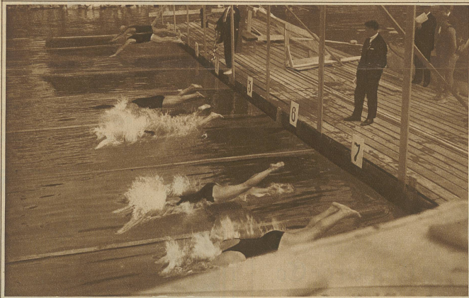
Start zum Ausscheidungsschwimmen für den Länderwettkampf Deutschland-Schweiz