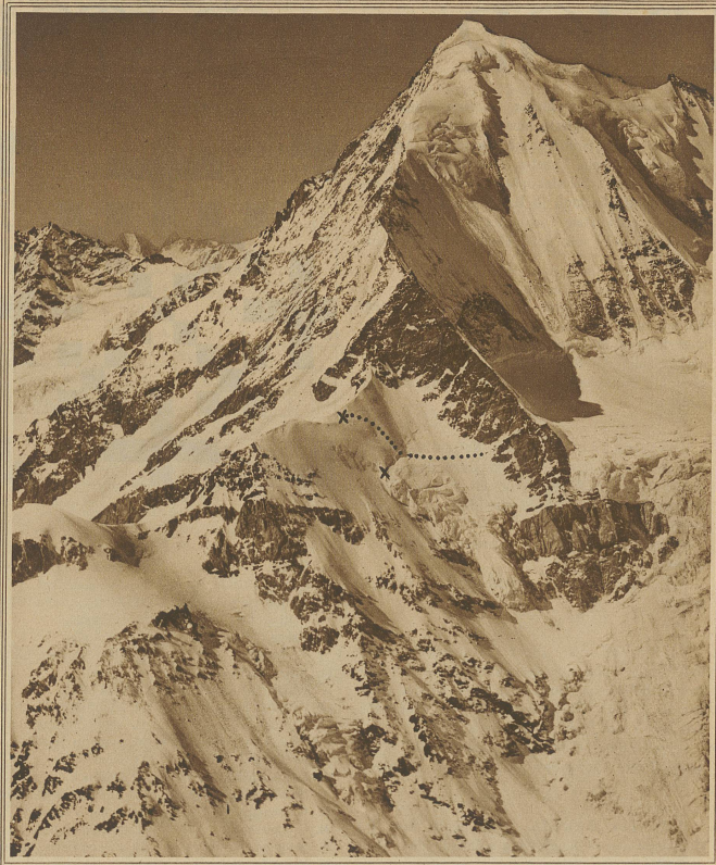
Vom Bergunglück am Walliser Weißhorn