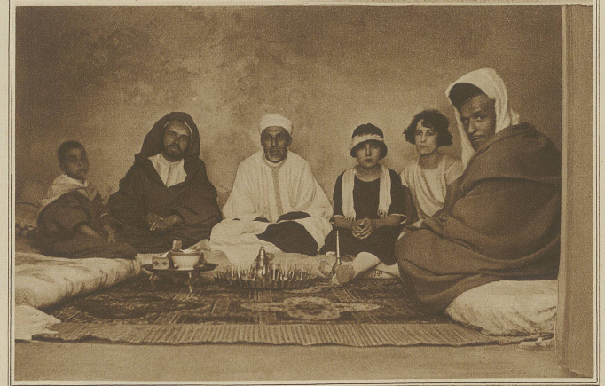
Auf Besuch bei Marokkanern

scheiden. Eine der Damen gerät in eine hier selten gesehene Lebhaftigkeit, als man ihr verdolmetscht, daß ich Konstantinopel kenne, ihre Vaterstadt, die sie mit ganzer Seele liebt und niemals wiedersehen wird. Sie lächelt, spricht lebhaft, die anderen sehen sie an, gewinnen an dem Gespräch Interesse, und ich sage mir, daß unter diesen Stoffpaketen doch vielleicht etwas wie eine Frauenseele schlummert. Aber sie scheinen nicht unglücklich; sie verbringen den Tag damit, sich anzuziehen, Besuche zu empfangen und Zuckerwerk zu naschen. Gott gebe, daß sie darüber im unklaren bleiben, daß es in der Welt noch andere Dinge gibt, die sie sich nicht verschaffen können. Ihr Herr und Meister würde sich wohl auch Emanzipationsgelüsten gegenüber wenig entgegenkommend zeigen. Es sind fünf Frauen, die anscheinend ganz gut miteinander auskommen. Daneben ist noch eine kleine Zirkassierin, die erst kürzlich angekauft wurde, die ein hübsches Gesicht hat, das noch nicht die entsetzlichen Tätowierungen zeigt.