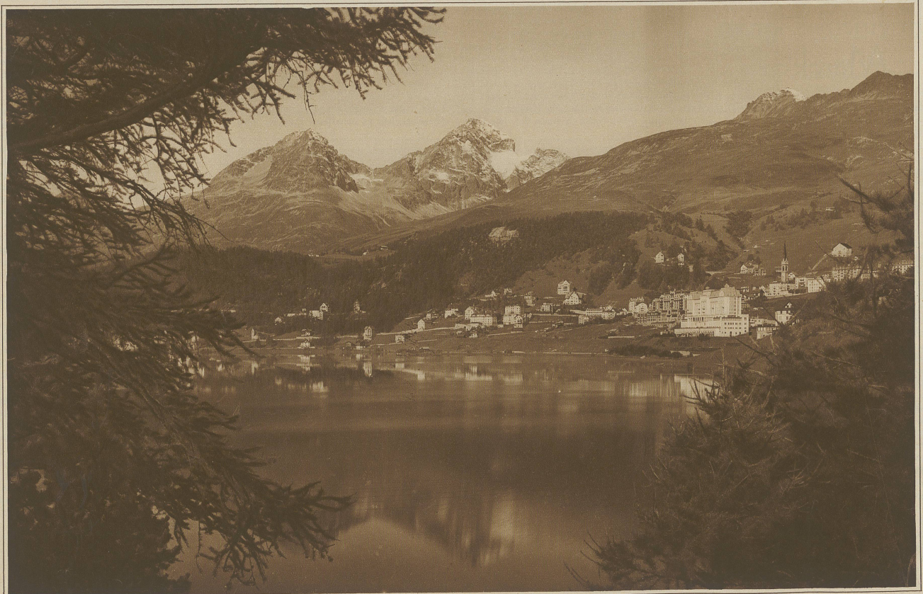
St. Moritz mit Piz Albana und Piz Julier