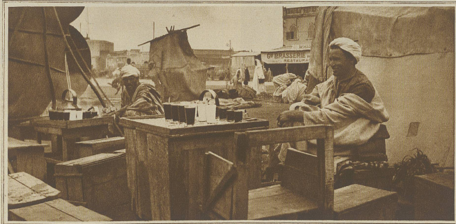
Marokkanische Bar in Marrakesch

schmalen weißen Filzhut mit breiter Krempe. Ein paar lustige Augen blickten aus dem rundlichen hübschen Gesichtchen. «Also so sehen Sie aus?» sagte sie und reichte Arthur die Hand, «ich hatte Sie mir etwas anders vorgestellt.» «Nun, das macht nichts», meinte er, «ich werde versuchen, Ihnen auch so zu gefallen.» Sie fuhren in den neu eröffneten Lunapark und amüsierten sich königlich. Keine Attraktion wurde ausgelassen, von der Rutschbahn über das Teufelsrad bis zum Hippodrom. Arthur hatte eigentlich nicht viel zu sagen, Lilly redete stundenlang.