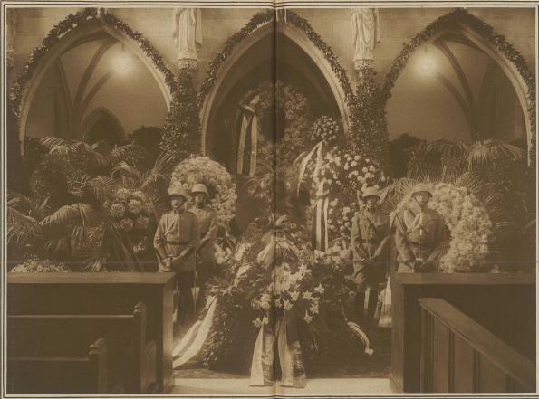
Die Ehrenwache am aufgebahrten Sarge in der Fraumünsterkirche