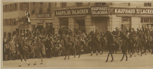
Die Kavallerieschwadron im Trauerzuge