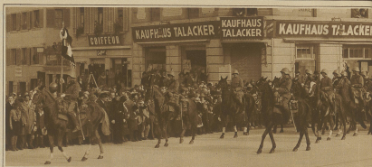
Die Kavallerieschwadron im Trauerzuge