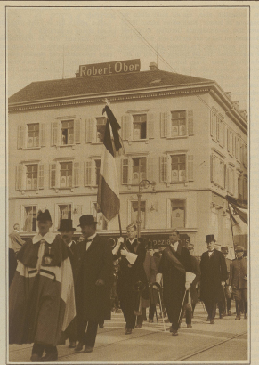
Abordnungen der Behörden und des Corps Tigurina