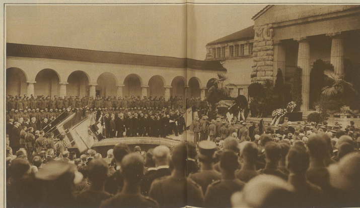
Der Sarg entschwimmt, die Fahnen senken sich. Drei Schützen ins kühle Grab...