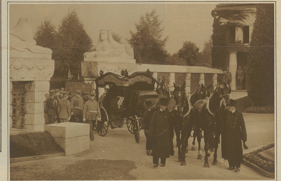
Am Eingang ins Krematorium