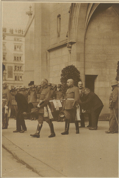
Nach der Abdankung in der Fraumünsterkirche