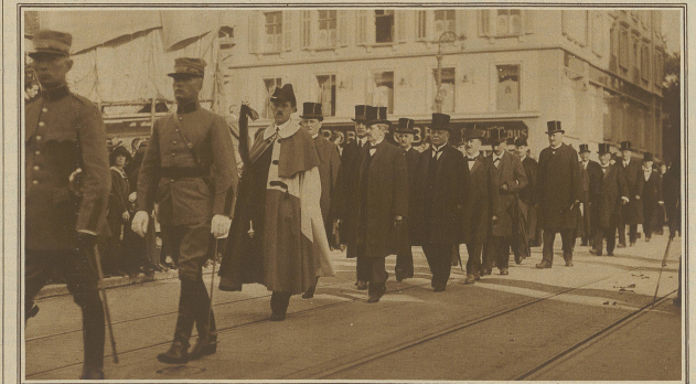
Delegationen der Behörden im Trauerzuge