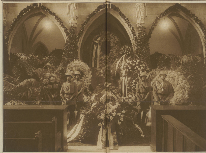
Die Ehrenwache am aufgebahrten Sarg in der Fraumünsterkirche

Korps- kommandant Steinbuch in Zürich