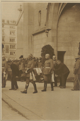
Nach der Abtastung in der Fraumünsterkirche