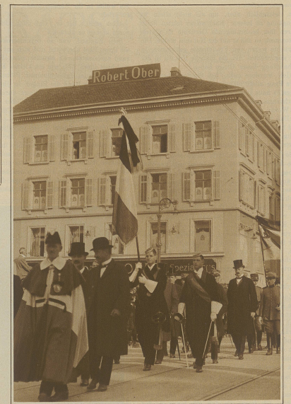
Abordnungen der Behörden und des Corps Tigurina