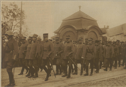
Offiziere im Trauerzuge