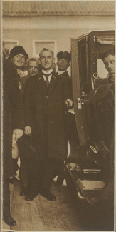
Die Paktkonferenz