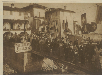
Die Pressevertreter auf dem Landungssteg