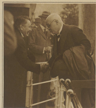
Herrliche Begrüßung zwischen dem deutschen Reichsminister Dr. Luther, mit dem französischen Außenminister Briand