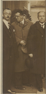
Mussolini begrüßt die deutsche Delegation