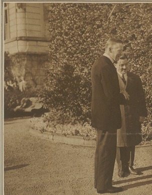
Eine elegante und elegante Oberhauptin war am Festtag des englischen Außenministers Chamberlain, die Herrin von Locarno. Ein Teufel