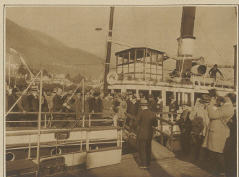
Ein Boot deutscher Journalisten auf einer Vergnügungsfahrt nach dem glücklichen Abschluß der Paktkonferenz