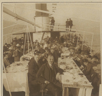
Das Presse-Bankett auf dem Schiff