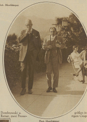
Chamberlain und sein Cernelli