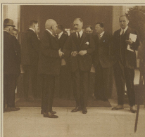
Reichsminister Dr. Luther im Gespräch mit Journalisten nach dem Presserückblick