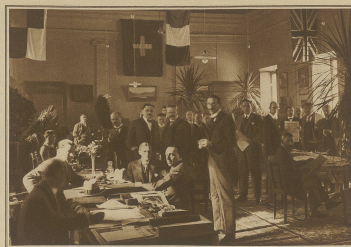
Blick in den Pressaal