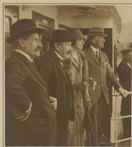
Chamberlain, sein Cernelli, Borelet, gewartet auf dem Schiff die deutsche Delegation