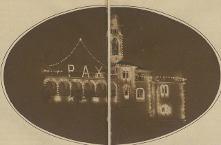
Das weit in die Länge reichende Freige- bäude «PAX» auf der Madonna del Saio