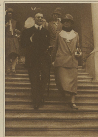
Chamberlain und sein Cernelli verlassen die Paktkonferenz