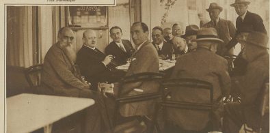
Stimmen erteilt die Presse beim Abendessen