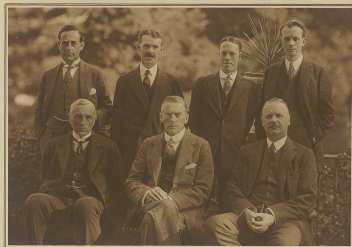
Die englische Delegation