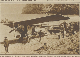
Zu den Kämpfen in Moskau. Ein sehr schön gestaltetes Gebäude, das zum Kampf gegen die Befreiung verwendet wird. Dichter eine amerikanische Expedition