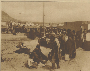
Das Leben der Bevolkerung vor der Stadt Damaskus