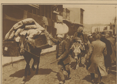
Typisches Bild in einer StraÙe von Damaskus