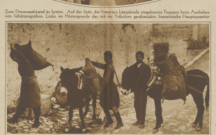
Zum Dreimächteabstand in Syrien. Auf der Fahrt der Franzosen überbrachte Transportwagen, Anzeichen von Selbstmord. Ländl im Hintergrunde des mit ein griechischer geschützter Transportwagen