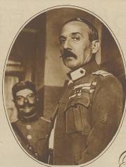
General Pando, der Führer der Griechen