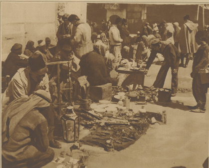
Damaskus. StraÙenstndler bieten ihre Waren feil