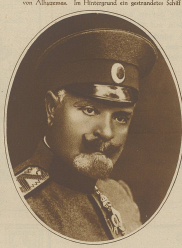
General Lazarus, der Oberbefehlshaber der griechischen Armee