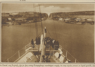
Der Kanal von Korinth, der an dem ersten Kanalbauwerk verbleibt, ist nun wieder soweit in Ordnung gestellt, dass er für die Schiffe frei gegeben werden konnte. Dieser Kanal ist seit der Eröffnung in den Jahren