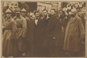
Das Begehren der russischen Handelsvertreter in New York, die bei einem Sturm auf russische Waren verfallenen, teuren Busen in Moskau statt. Unter Bild zeigt Trgler beim Tragen des Sauges eines Erwaehnten Skizavsky