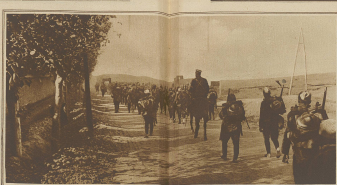
Zum griechisch-türkischen Konflikte. Griechische Infanterie auf dem Vormarsch