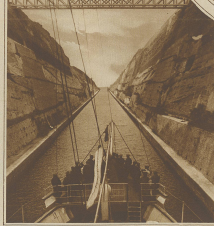
Zur Wiederaufnahme des Kanals von Korinth. Ein Schiff auf der Fahrt durch den Kanal