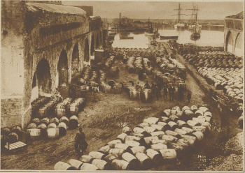
Vom griechischen Wein. Mächtige Weinstube im Hofe von Kanda auf Kreta