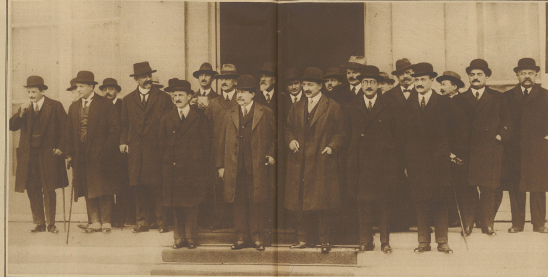
Das neue französische Kabinet. Mitterrand in der Mitte