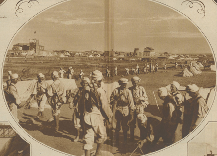
Zum Dreimächteabstand in Syrien. Bild auf Damaskus, das letzte Tage der Scherzhaftigkeit der Streitkräfte vor