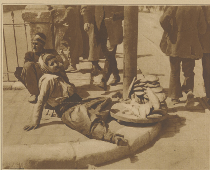
Beethnder an einer StraÙencke in Damaskus