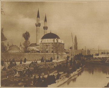
Vor der Moschee am Basra-FluÙ im belagerten Damaskus