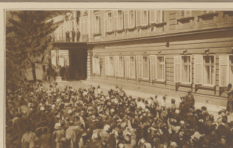
Zum griechisch-türkischen Konflikte. Das Volk begrüßt den Zair vor dem Palast in Sidon