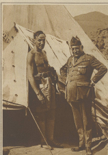
Der französische Botschafter in Moskau. Der griechische Botschafter in Moskau