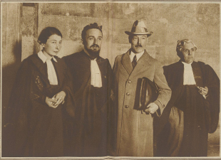
Der griechische Botschafter in Moskau. Der griechische Botschafter in Moskau