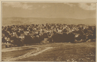
Zum griechisch-türkischen Konflikte. Bild auf die belagerte Stadt Sidon, die von den Griechen besetzt wurde