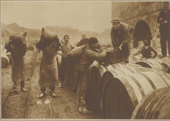
Vom griechischen Wein. Der Rebensaft wird aus den Trauben in Fässer gefüllt