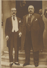
Der französische Botschafter in Syrien. Der griechische Botschafter in Syrien