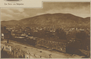
Zum Dreimächteabstand in Syrien. Bild auf Damaskus, das letzte Tage der Scherzhaftigkeit der Streitkräfte vor