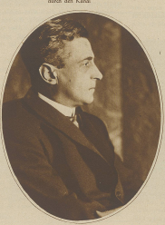
General Lazarus, der Oberbefehlshaber der griechischen Armee