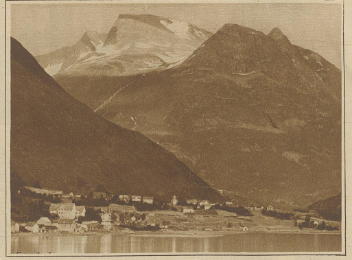
Blick auf Sven, das ebenso gut in der Schweiz wie am Nordfjord liegen könnte

Nun gilt es Abschied zu nehmen von Bergen. Mit der Bergbahn sause ich noch einmal auf die Spitze des Floyen. Blutrot versinkt die Sonne im Fjord. Wie zu frohem Feste geschmückt liegt in der Tiefe die erleuchtete Hansestadt. Von schimmernden Perlensträngen ist ringsum die Bucht umkränzt. Dampf schallen die Signale der aus- und einfahrenden Dampfer zu mir herauf. Hell erleuchtete Motorboote huschen über den Hafen. Wie Glühwürmchen flirren die Autos durch die Straßen. Wie eine feurige Schlange windet sich ein Zug der Bergbahn durch das dunkle Tal. Um die beiden Binnenseen ziehen sich glühende Guirlanden. Das ganze Tal scheint mit Tausenden von Sternchen bestückt. Von den Hügeln am Fjord blitzen die Lichter der Landhäuser. Ich kehre auf den sich in Serpentina herabschlängelndem Wege zu Fuß zurück. Bald umfängt mich wieder das Getümmel der Stadt. In schneller Fahrt führe mich das Auto zum Quai der Fjorddampfer.