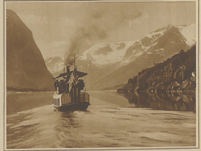
Eine Fahrt auf dem Oldensee