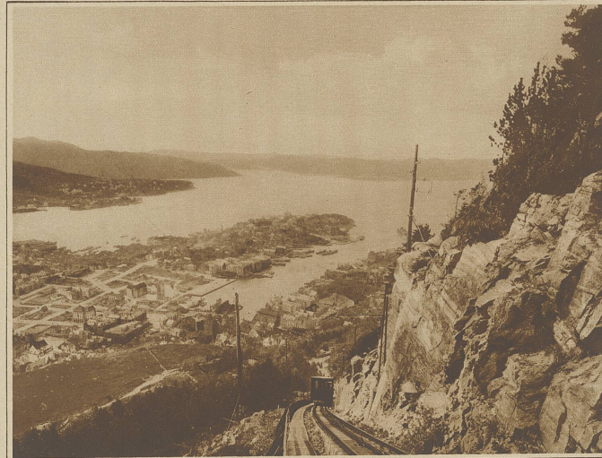
Die Stadt Bergen. Im Vordergrund die Bahn auf den Floyen-Felsen

In Naustadt, Nordfjordeid, Sandane, Utviken, Stryn legen wir an. Ein Ort immer idyllischer gelegen wie der andere. Auf grünen Abhängen die rot-gelben Häuschen, umrahmt von dunklem Wald. Von steilen Felsen grüßen Gebötte und Semnhütten. Dahinter erheben sich weißglitzernde Bergriesen. Inmitten des Friedhofes das alte Kirchlein. Dicht am Ufer pittoreske grasbedeckte Bootshäuschen.