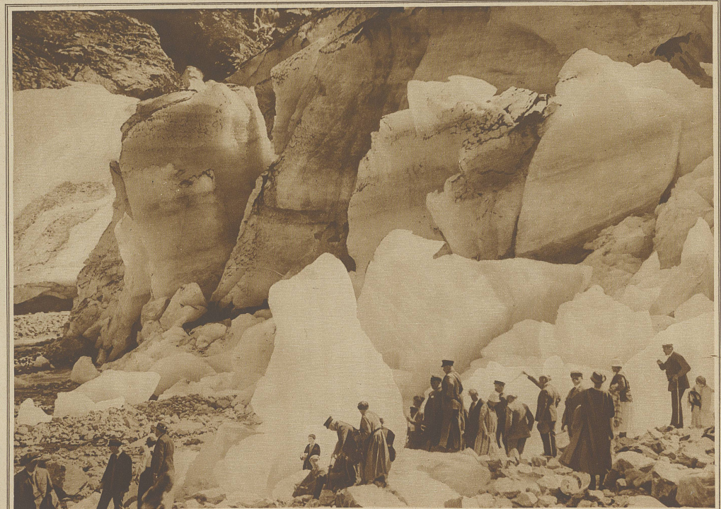
Der Absturz des «Jostedalbrae», des größten europäischen Gletschers

Noch lange saß ich des Abends mit dem freundlichen Wirt plaudernd im Salon, während im Kamin die Scheite knisterten. Alle Einzelheiten der morgigen großen Autofahrt vom Nordfjord zum Sognefjord wurden genau besprochen. In meinem schneeweiden Zimmer wiegt mich das Rauschen des Fjords in tiefen Schlaf.