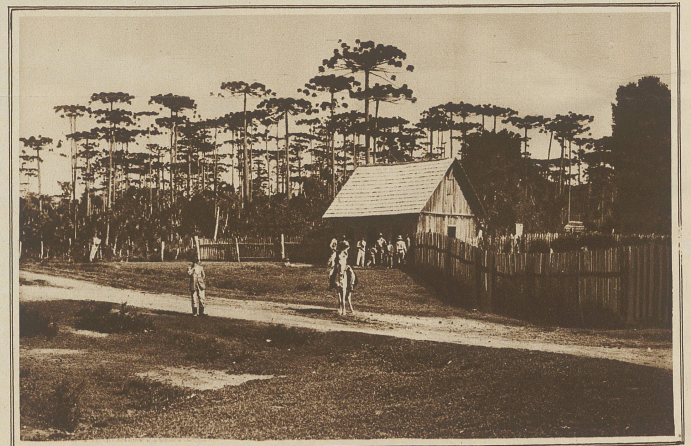
Vor dem Schutzhause einer Farm, die mitten in einem prächtigen Pinienwalde liegt

Die Lokomotive siedet schrill, sie nimmt hier wieder Holz. Was für ein Magen! Von neuem beginnt das Hackhack der Räder auf den Schienen, gleich einem raschen, endlosen Versmaß, und weiter geht es durch den smaragdgrünen schönen Wald, aus dem modriger, feuchter Treibhausdunst herüberweht. Dicht steht das giftgrüne, hohe Bambusgebüsch, in grazioser leichter Biegung neigen die Palmen ihre Kronen ein wenig über den Bahndamm, in so anmutiger Linie, wie sie kein anderer Baum beschreibt. Und wiederum führt der Weg über tollkühne Eisenviadukte vorbei an Katarakten, breiten, kalkweißen Gischtbändern. Hunderte von Metern stürzen die Wassermengen mit gewaltigem Tosen und Lärmen zu Tal. Dicht neben den Wagen schüttet ein Gießbach seine Wasser in einer langen blaßgrünen Säule herab. Unten in dem felsigen Bett zerstäuben sie zu einer einzigen Schaummasse, um sich dann wieder zu sammeln und dem salzigen Meere zuzuströmen, in stürzenden, wütend bohrenden Strudeln. Der Zug erklimmt das letzte Stück des Gebirges, und bald bin ich am Ziel.