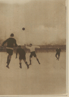
Crashoppers in Zürich. Blue Stars - Aarau. Aarau Torwart befreit.