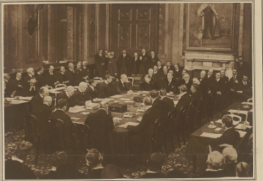
Die hierliche Schlußfeier zur Unterzeichnung der Verträge von Locarno im englischen auswärtigen Amt in London.