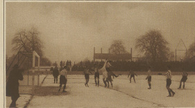
Eine Ecke vor dem Tor der Zürcher.