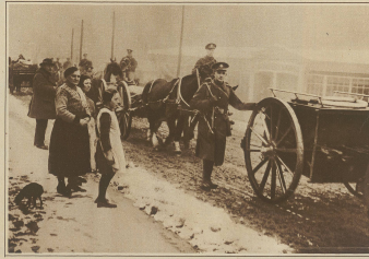
Zur Räumung Kölns. Der Abzug der englischen Truppen.