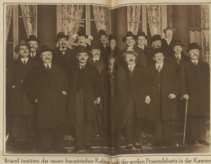
Brüder stimmten das neue französische Kabinett nach der großen Finanzdebatte in der Kammer.