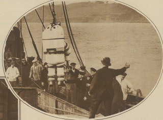
Heilungsmethode des verstorbenen engl. Linsenwebers M. J. 24-1910 gekennzeichneter Rettungsversuch. Mit einem aus einer einseitig konstruierten Taucherglocke eingestrichelten Mann im Wasser.