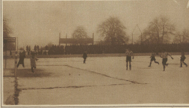
Crashoppers - Zürich. Das erste Tor gegen Zürich.