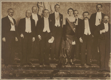
Zur Unterzeichnung der Verträge von Locarno. Die bevollmächtigten Minister aus Belgien, Frankreich, Italien, England, Spanien, Portugal, Griechenland, Jugoslawien, Litauen, Lettland, Estland, Finnland, Dänemark, Schweden, Norwegen, Polen, Tschechien, Jugoslawien, Rumänien, Griechenland, Türkei, Albanien, Jugoslawien, Litauen, Lettland, Estland, Finnland, Dänemark, Schweden, Norwegen, Polen, Tschechien, Jugoslawien, Rumänien, Griechenland, Türkei, Albanien.