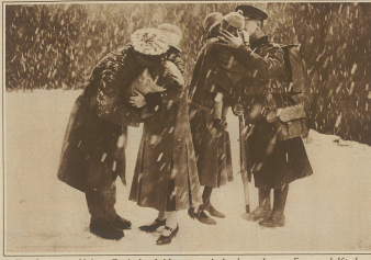
Zur Räumung Kölns. Englische Soldaten verabschieden sich von Frau und Kind.