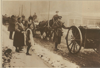
Zur Räumung Kölns. Der Abzug der englischen Truppen.