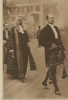
Zur Entlassung des englischen Staatspräsidenten in London. Der Lordkanzler Viscount Cave, kehrt von der Westminster-Halle zum Platz der Stadt zurück.