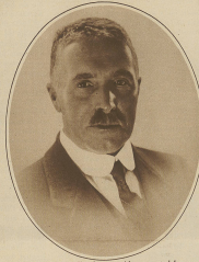
Die Kasse-Rief aus Zürich in ein Alter von 88 Jahren in Paris gestorben.