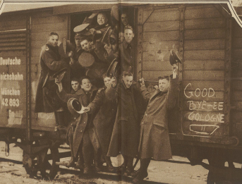
Der Abzug der Besatzungsmänner aus Köln. Englische Soldaten anbieten der Bevölkerung für Lebensmittel.