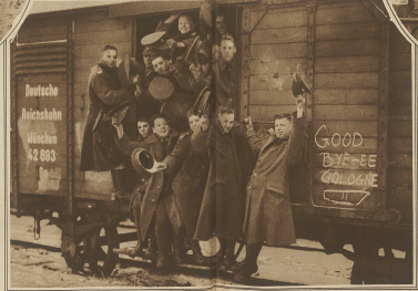
Der Abzug der Besatzungsmänner aus Köln. Englische Soldaten anbieten der Bevölkerung für Lebensmittel.