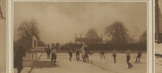
Cricket in Zürich. Das erste Tor gegen Zürich.