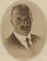
Die Kasse-Rief aus Zürich in im Alter von 28 Jahren in Paris geboren.