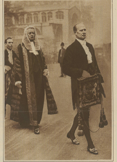
Zur Entlassung des englischen Staatspräsidenten in London. Der Lordkanzler Viscount Cave, kehrt von der Westminster-Haus zum Platz der Stadt zurück.