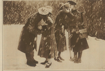
Zur Räumung Kölns. Englische Soldaten verabschieden sich von Frau und Kind.