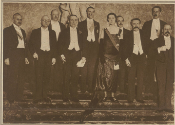
Zur Unterzeichnung der Verträge von Locarno. Die bevollmächtigten Minister aus Belgien, Frankreich, Italien, England, Spanien, Portugal, Griechenland, Jugoslawien, Litauen, Lettland, Estland, Finnland, Dänemark, Norwegen, Schweden, Österreich, Ungarn, Tschechien, Polen, Belgien, Frankreich, Italien, England, Spanien, Portugal, Griechenland, Jugoslawien, Litauen, Lettland, Estland, Finnland, Dänemark, Norwegen, Schweden, Österreich, Ungarn, Tschechien, Polen.