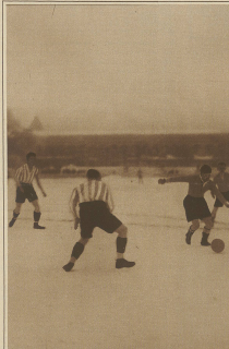
Honigser schließt an Erwanger vorbei.