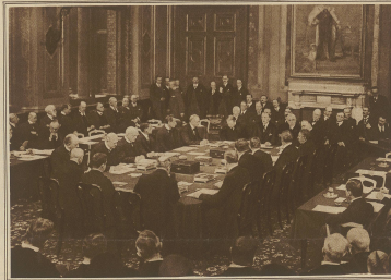
Die literarische Schließung zur Unterzeichnung der Verträge von Locarno im englischen auswärtigen Amt in London.