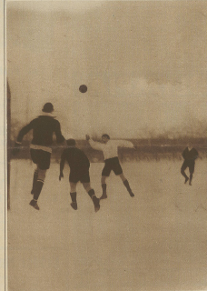
Cricket in Zürich. Blue Stars - Aarau. Aarau Torwart befreit.