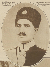
Reza Khan, der nach Abkündigung des in Persien verbliebenen