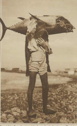
Ein prächtiges Exemplar eines auf den karaischen Inseln gefangenen Theobates