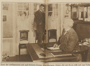
Einer der vielfagertesten und wohlhabendsten Zoroastriern, der nur 20 an die Zahl der zum Verfall der neuen Religionen auf der Welt gebliebenen sind, um zur Erhaltung zu kommen