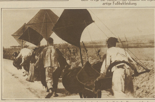
Spielmannen in China. Um sich die Arbeit zu erleichtern, haben die chinesischen Kofler ihre Karren mit Stroh gefüllt, die bei den durch den Verkehr verursachten Witterungsänderungen vorzügliche Dämme bilden