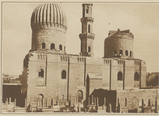
Syrische Mameluckengräber in Caïron