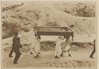
Die Mythen des Paracelsusgrabs. Transport eines Leichnams aus dem Grabe Turan-Grabs unter türkischer Bedeckung