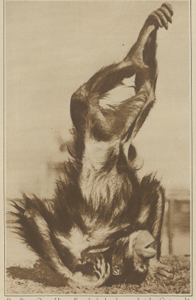
Dem Rassen «Orange-Uinge» «Kessig», die Leuchtener präcolombischen Urvaters geht es so sat, daß er von Vespertigen auf dem Berge steht