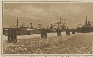
Blick auf den vereisten Segelschiffhafen von Hamburg, dessen Verkehr durch das viele Treiben betrüblich vollständig lähmungsartig wurde