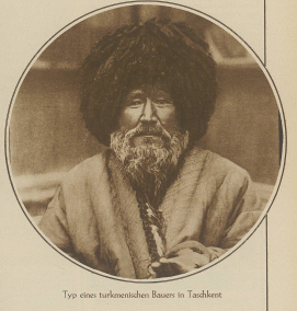
Typ eines türkischen Bauern in Tschikment