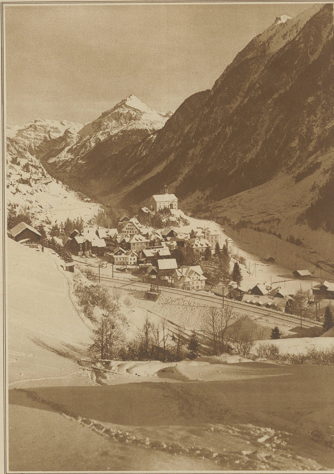
Blick auf Wassen an der Gotthardbahn In Hintergrund die Kleine Windgälle

Sie saßen auf der Terrasse und warteten auf das Zeichen für das Abendessen. Madame hatte sich gekleidet, als gälte es, sich für die Promenade von Longchamps vorzubereiten. Nicht