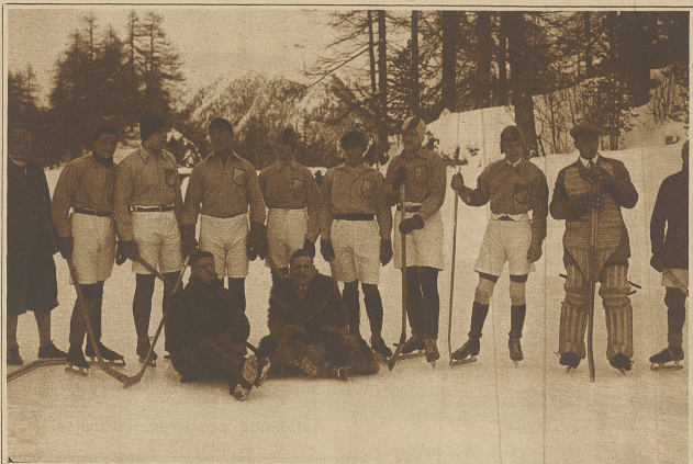
Die Eishockey-Mannschaft von St. Moritz, die am