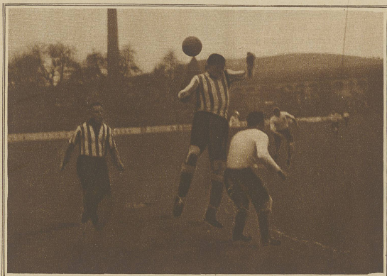
Die Verteidigung der Zürcher im Kampfe mit dem Sturmführer der Italiener