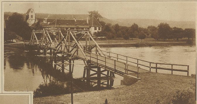
Die fertige Brücke über den Nidau-Büren-Kanal