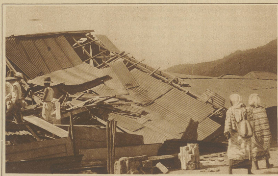
Militär und Polizei suchen die Schuttmassen nach Toten und Verwundeten ab