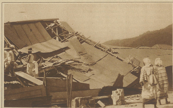
Militär und Polizei suchen die Schuttmassen nach Toten und Verwundeten ab