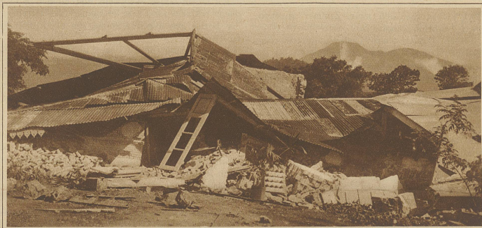
Verwüstungen in einer Straße des Chinesenviertels