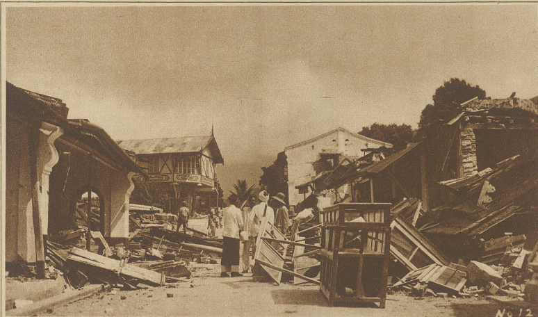
Eine Dorfstraße in Padang-Pandjang, wo die größten Verheerungen angerichtet wurden

Unser Mitarbeiter H. Kläsi, ein auf Sumatra ansässiger Schweizer, schreibt uns unterm 6. Juli: «Am 28. Juni a. c. ist die Insel Sumatra der Schauplatz eines Erdbebens geworden, wie es dieses Land seit Menschengedenken nicht gekannt hat. Am schwersten wurde der mittlere Abschnitt der Westküste (zwischen den Vulkanen Talang, Merapi und Singalang) davon betroffen. Größere und kleinere Ortschaften sind förmlich dem Erdboden gleichgemacht worden, oder haben sonst schweren Schaden gelitten. Die Zahl der Toten läßt sich zur Stunde, da diese Zeilen geschrieben werden, noch nicht annähernd bestimmen, da das Rettungswerk durch den Umstand ungemein erschwert wird, daß sich die inländische Bevölkerung weigert, aus freien Stücken Hand an die Aufräumungsarbeiten zu legen. Es scheint diese Erscheinung auf ihren mohammedanischen Fatalismus zurückzuführen zu sein. Militär und Polizei müssen die Eingeborenen mit Gewalt zur Arbeit anhalten. Noch viele Opfer liegen überall unter den Trümmern begraben. Da die tropische Hitze die Verwesung befördert, ist die Luft verschiedenerorts bereits mit Leichengeruch verpestet. — Soviel sich heute überblicken läßt, rechnet man im gesamten Erdbebengebiet im günstigsten Fall mit ca. 600 bis 800 Toten, die Zahl der Verwundeten ist ebenfalls sehr beträchtlich. Der Materialschaden wird auf einige Millionen Gulden geschätzt»