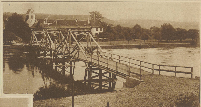
Die fertige Brücke über den Nidau-Büren-Kanal