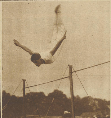
Henzi, Wipkingen, beim Reckturnen