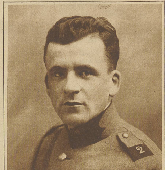
Der beim Autounfall bei Dübendorf getötete Fliegerleutnant Basigny.