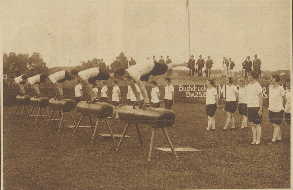
Schweiz. Arbeiter-Turn- und Sportfest in Bern