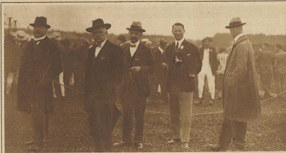
Bundesrat Scheurer und Oberst Steiner in Begleitung von Nationalrat Grimm als Ehrengäste der Arbeiterturner