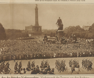
Aus der deutschen Verfassungsfeier. Vorbeimarsch der Truppen vor dem Reichstag.