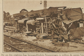
Der aus dem ersten Lager herausgehobene Panzerwagen, in welchem die meisten Toten gefunden wurden. Ein neues Eisenbahnwaggon in der Nähe Münschen. Letzte Woche erbeutete, wahrscheinlich infolge einer unglücklichen Weiche, auf der Station Langenbach der hochberühmte Panzerwagen-Mörder.