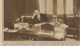
Ein Bild, das den Mann zeigt, der in den letzten Jahren die Verfassung des Landes in der Schweiz zu einem der besten in Europa gemacht hat.