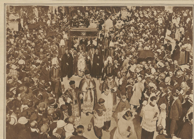
Aus den Erhebungsfestlichkeiten des solonischen Wallfahreres Maristain. Mitglieder der päpstlichen Nuntiatur in der Prozession.