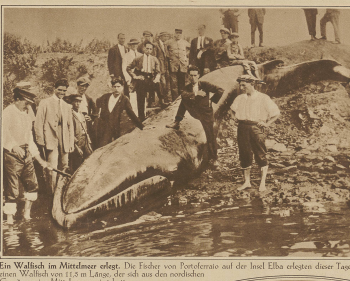
Ein Wallfisch im Meerwasser elegt. Die Fischer von Fardomato auf der Insel Elba erbeuten diese Tiere einen Wallfisch von 118 m Länge, der sich aus den nordischen Gewässern im Mittelmeer verirrt hatte.