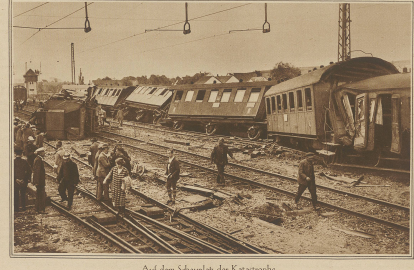
Auf dem Schauplatz der Katastrophe.