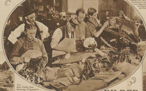
Aus dem Atelier eines schweizerischen Fabrikanten, dessen Creditfähigkeit eine derartige Menge von Vollkommenheit erreicht hat, dass die ausgestellten Tiere oft als lebend angesehen werden.