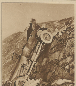
Die 10. April hat ein Auto, das 8 Personen und einen Fahrer, an der Höhe von 1000 m über dem Meeresspiegel, die Straße hinunter auf den Felsen und in die Tiefe stürzte.