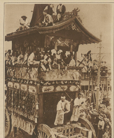
Wie man im Oster-Fest hier. Trossen von den Unzen willfähr die besten spanischen Fests. Capa Manera, an welchen posten die ganze Bevölkerung teilnimmt.