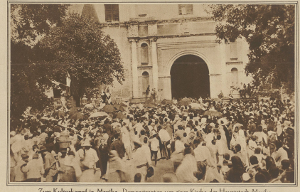
Zum Kulturkampf in Mexiko. Demonstranten vor einer Kirche der Hauptstadt Mexiko.