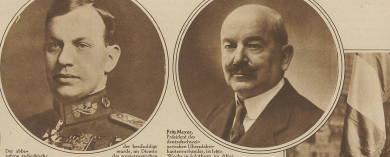
Die beiden Herren, die in der Schweiz die Verfassung des Landes zu einem der besten in Europa gemacht hat.