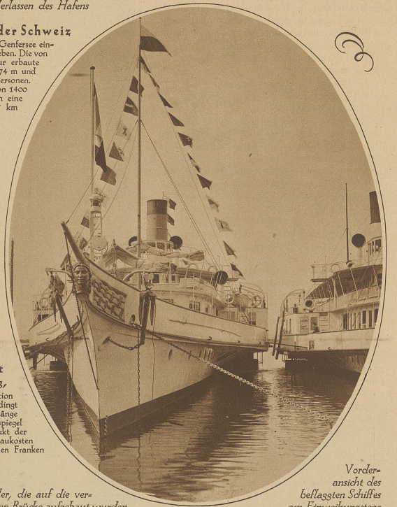
Vorderansicht des beflaggten Schiffes am Einweihungstage

Ansicht der mächtigen Pfeiler, die auf die verstärkten Fundamente der alten Brücke aufgebaut wurden