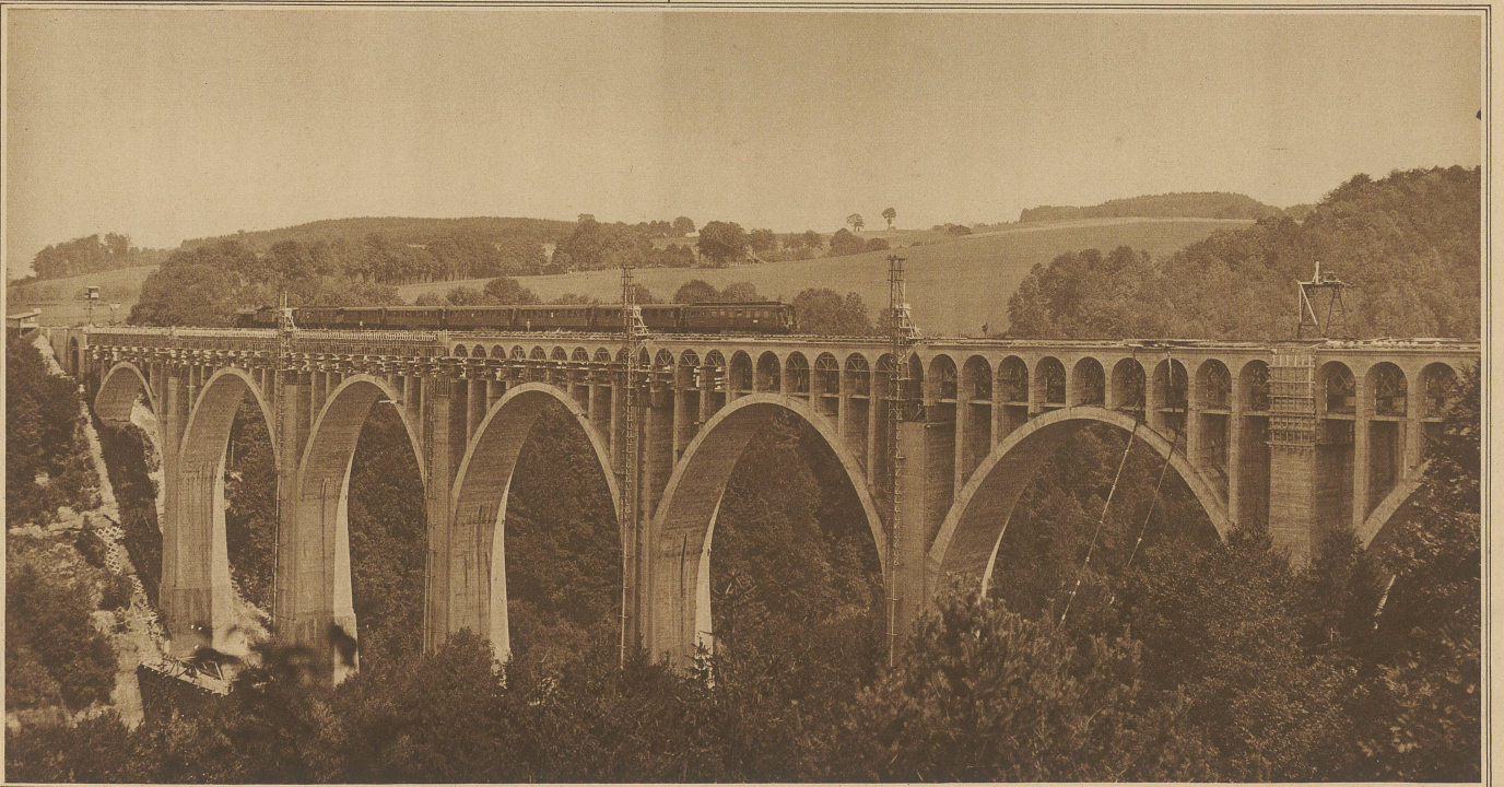
Gesamtansicht des Viaduktes von Grandfey, im Moment, wo ihn ein Schnellzug Zürich-Genf passiert