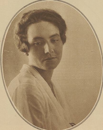
ELSE SCHULZ, jugendlich-dramatische Sängerin