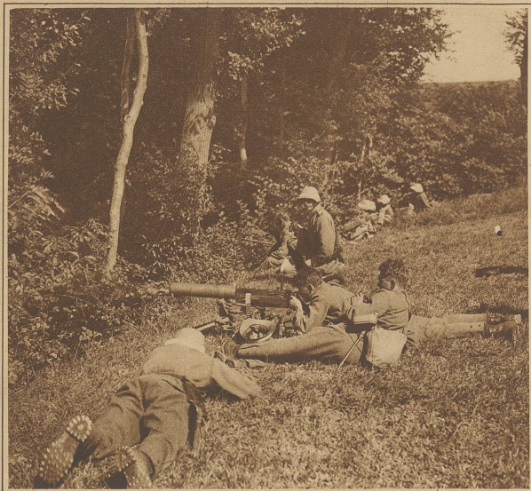
Maschinengewehre in Feuerstellung