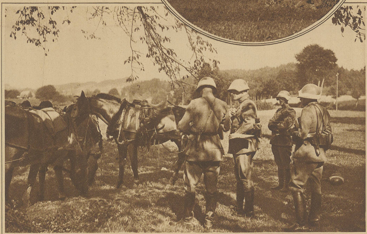
Befehlsausgabe bei der Gebirgs-Brigade 9 (Oberst Prist)