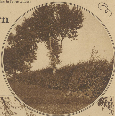
Bild rechts: Maskierte Batteriestellung. Das moderne Kampfverfahren hat mit den ehemals prächtigen Manöverbildern gründlich aufgeräumt und die «Leere des Schlachtfeldes» bietet der Kamera des Photographen nur selten noch ein dankbares Objekt. Hinter der Hecke, vom Strauchwerk auch gegen Fliegersicht völlig verdeckt, befinden sich zwei Feldbatterien in Schußstellung