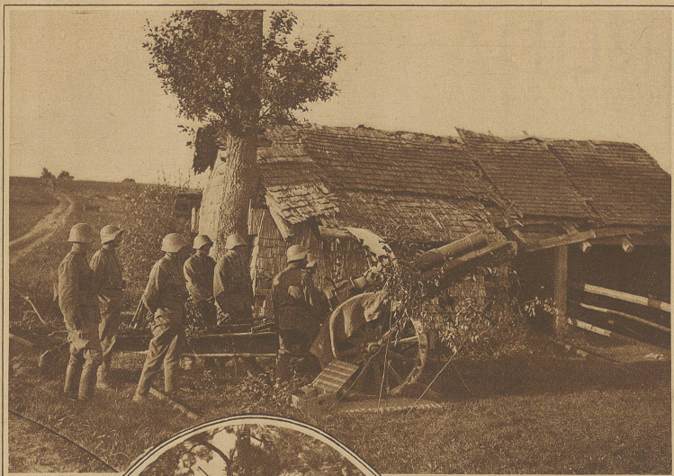
Schwere 15 cm-Haubitze in Stellung hinter Schmitten