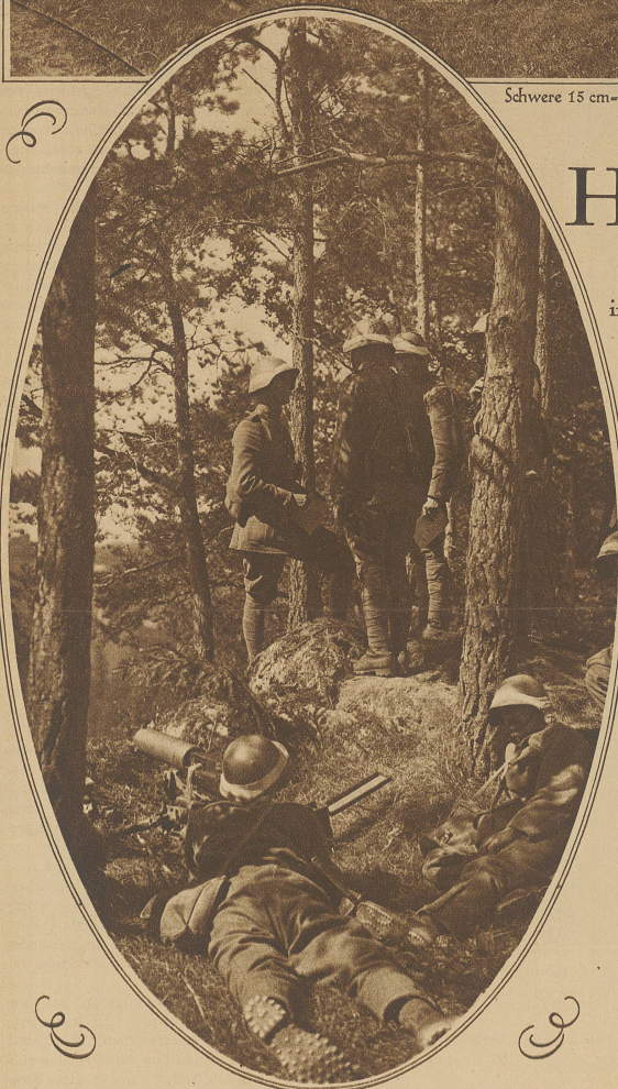
Gefechtsstand einer Mitrailleurkompanie am Waldrand