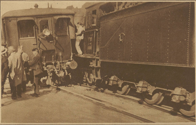
Zugezusammenstoß in Näfels. Letzten Samstagnachmittag fuhr zufolge eines Versehens der von Ziegelbrücke fällige Personenzug auf einen in der Station Näfels manövrierenden Güterzug. Es entstand ein größerer Materialschaden. Von den Passagieren wurden 8 Personen leicht verletzt.