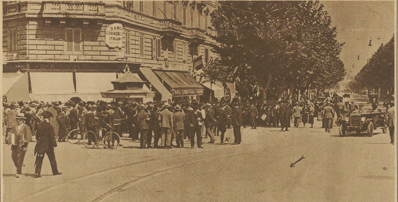
Der Platz vor der Banca Commerciale in Rom mit dem Zeitungskiosk, wo das Attentat verübt wurde. (X) Der Standort des Attentäters Lucertti, der Pfeil deutet die Fahrtrichtung von Mussolini's Wagen an. Die geschleuderte Handgranate prallte am Verdeck des Autos ab, fiel zu Boden und explodierte erst, als der Wagen schon einige Meter weitergefahren war.