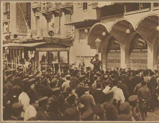
Proklamation des Belagerungszustandes in den Straßen von Madrid