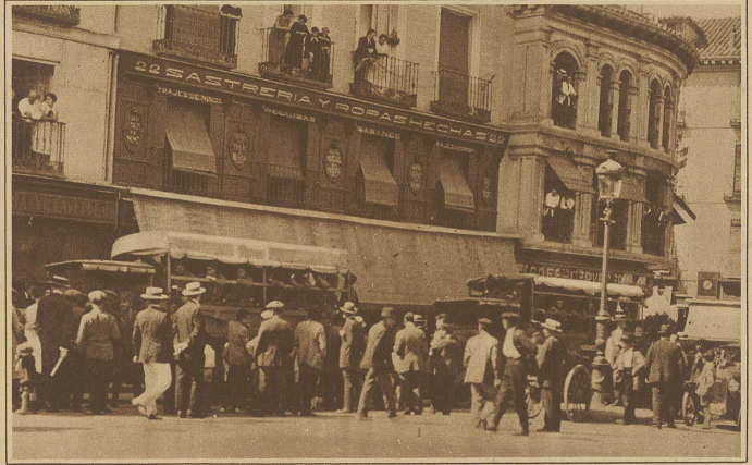
Zu den Ereignissen in Spanien