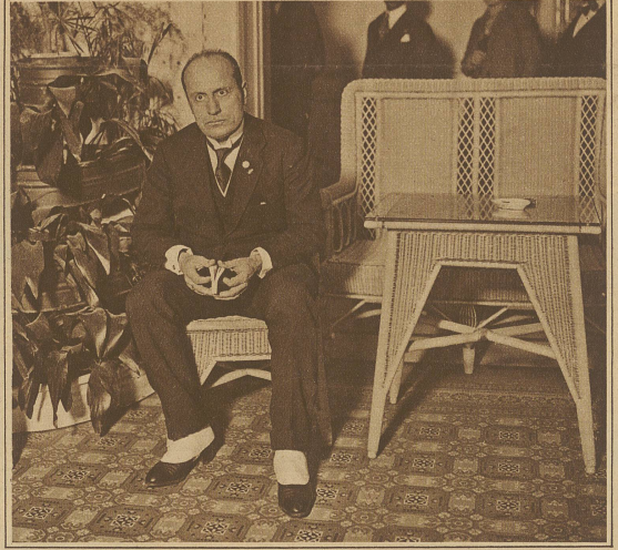
Mussolini wenige Minuten nach dem Attentat