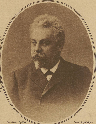
am 1. Technikum in Winterthur, Staatsrat Pythou von Freiburg beging diese Woche die seltene