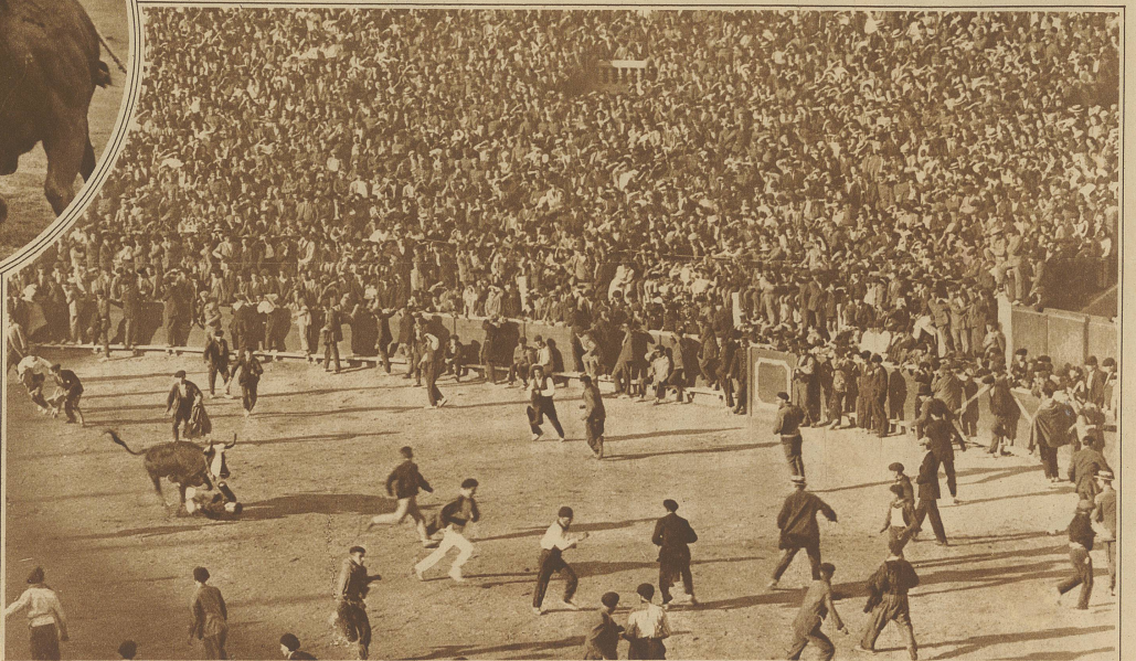
Eine «Novillada», an welcher jeder Zuschauer als Stierkämpfer teilnehmen darf. Diese wilden Kämpfe führen nicht selten zu schweren Unglücksfällen

welchen der nur mit seiner roten Capa versehene Torero den Stier immer und immer wieder auf sich anstürmen läßt und durch leichtes Beiseitewiegen des Körpers das wütende Tier an sich vorbeipassieren läßt, gehört zum Elegantesten des ganzen Stiergefächtes. Nun kommt die Reihe an die Bänderilleros, die ihre zwei kurzen Stäbe, die mit Widerhaken versehen sind, dem Stier in den Nacken stoßen. Im dritten Teil des Kampfes endlich tritt der Espada auf. Er tritt vor die Loge des Präsidenten des Stierkampfes und widmet diesem oder einer schönen Señorita oder einem seiner Freunde den Stier. Mit kurzem Schwert stellt er sich dem Stier entgegen und erspäht den günstigsten Augenblick, um dem Tier das Schwert rechts durch den Nacken ins Herz zu stoßen. Nicht endenwollender Applaus