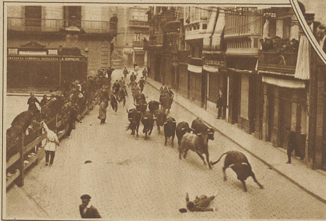
Stiergefächte in den baskischen Provinzen. Die halb-wilden Tiere werden zur Arena getrieben

So wiederholt sich das Schauspiel vier- bis sechsmal. Nicht immer aber geht die Sache glatt und glimpflich ab, oft wird aus dem Jäger der