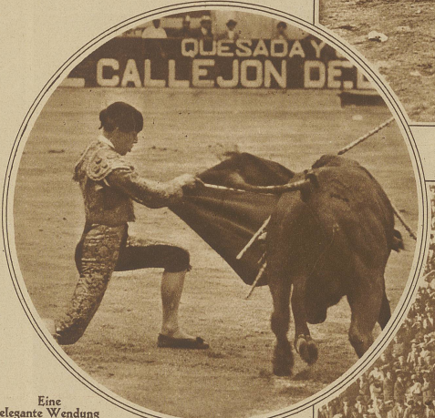
Eine elegante Wendung

offenen Wagen von der Bahn zur Arena gebracht. Man läßt die halb-wilden Tiere durch die abgesperrten Straßen rennen, begleitet von der Jungmannschaft des Ortes. Aber auch hier kann die Unvorsichtigkeit schwere Folgen haben,