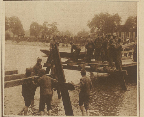
Pontoniere beim Brückenschlag über die Reuß zwischen Bremgarten und Eggenwil

Bild links: Generaloberst von Kluck (in Zivil), als Gast bei den Manövern. Links neben ihm Oberstkorpskommandant Biberstein, rechts Oberst Wille. Von Kluck führte im Weltkrieg die deutsche Nordarmee durch Belgien