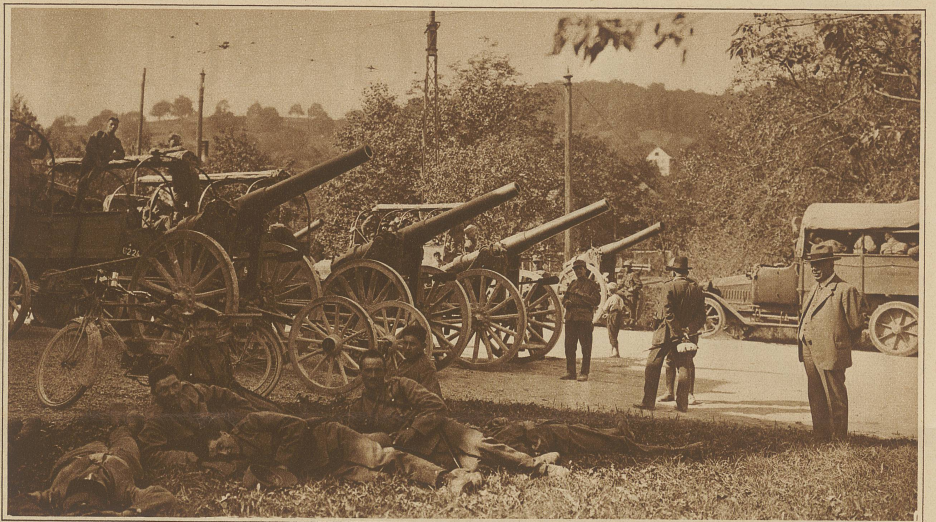
Schwere 12 cm-Motorbatterie in Reservestellung in Rudolfstetten