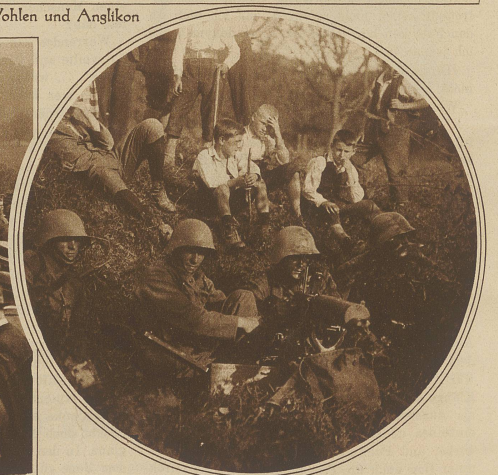
Maschinengewehnest in einer Hecke ob Bremgarten