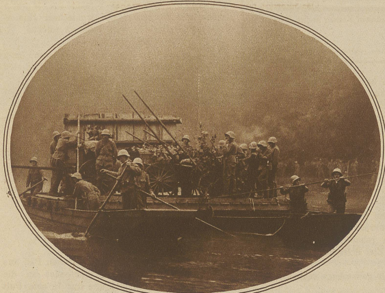
Rote Infanterie-Mittrailleure werden beim Morgengrauen auf einer Fähre bei Bremgarten übergesetzt