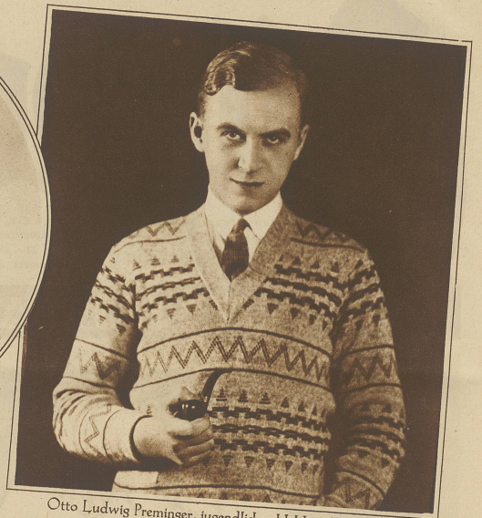
Otto Ludwig Preminger, jugendlicher Held und Liebhaber