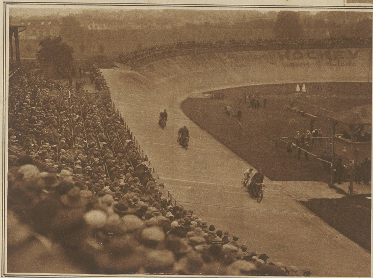
Aus dem Steherrennen um das goldene Rad, das von P. Suter überlegen gewonnen wurde