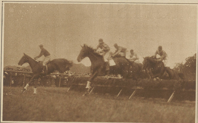
Aus dem Hürdenrennen um den Preis vom Gurten