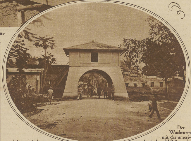
Der Wachturm mit der amerikanischen Militärwache

nert da, wurde jedoch nicht angerührt. Der Mann war im Nu von den erbitterten Soldaten erfaßt und in wenigen Sekunden buchstäblich in Fetzen gehauen. Auf ähnliche Weise sind eine ganze Anzahl Soldaten innerhalb kurzer Zeit ermordet worden.