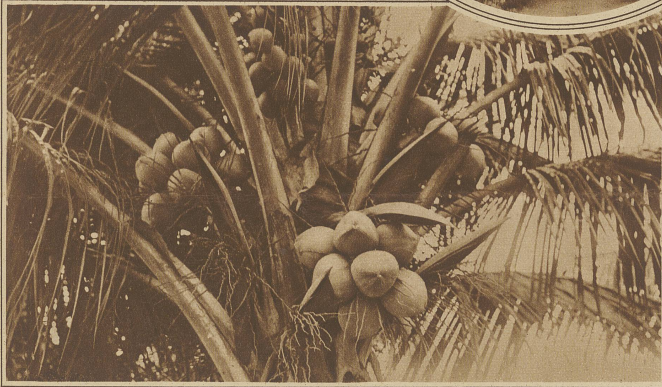
Eine Kokospalme, die gleichzeitig Blüten und Früchte trägt

Anordnung hervor, daß derjenige, welcher ohne Revolver auf der Straße angetroffen wird, bestraft wird. Der Gendarm ermahnte mich zur Vorsicht.