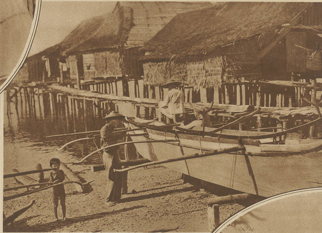
Fischer-Kanoe mit Auslegern. Rechts durch Stege miteinander verbundene Hütten von Eingeborenen

Einige mit den Verhältnissen vertraute Weiße sagten mir, wenn die Amerikaner nicht den großen Fehler begingen, einen solchen Mörder in hundert Stücke zu zerhacken, sondern ihn statt