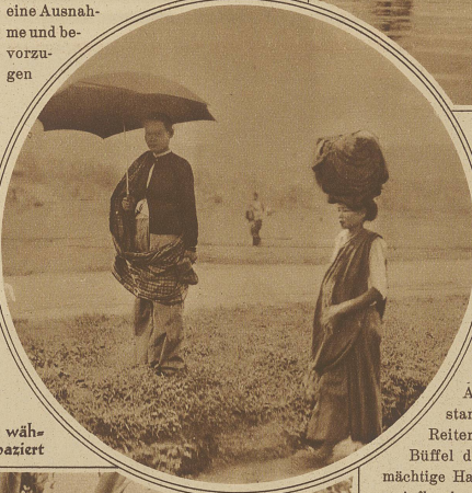
Die Frau trägt auf dem Kopfe eine schwere Last, während ihr Mann mit dem Sonnenschirm nebenher spaziert

gebrauten Schnaps anpreisen. Kaum habe ich meine Momentkamera zur Aufnahme bereit, als auch schon die ganze Gesellschaft unter den Tisch verschwindet, während der Rest sich hinter den Tischbeinen versteckt. Das größte Geschäft scheinen die Händler mit Betelnüssen zu machen, denn alles kaut, ganz einerlei, ob jung oder alt, Mann oder Weib, nur die kleineren Kinder machen eine Ausnahme und bevorzugen