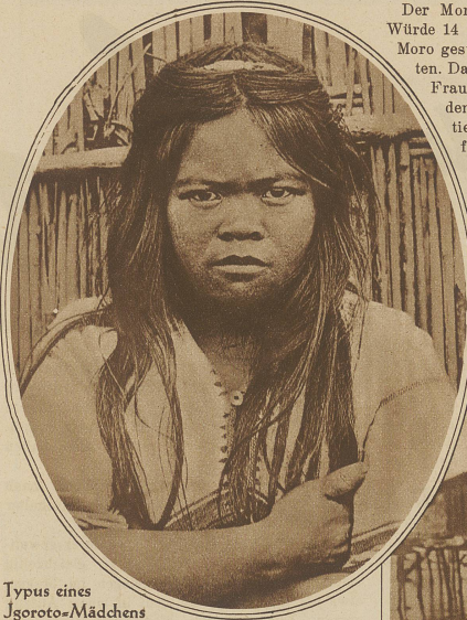
Typus eines Joroto-Mädchens