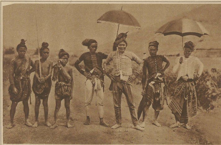
Moro Datto (Häuptling) mit seinem Gefolge. Zum Zeichen der Würde trägt der Schirm des Dattos Fransen

dessen in schweren Ketten arbeiten lassen würden, um dem Volk zu zeigen, daß er nicht in den Himmel geritten sei, sondern schwer arbeiten müsse, so würden sie einen ganz andern Erfolg im Kampf gegen diese Bestien haben.