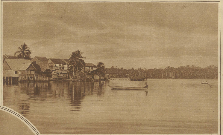
Teilansicht von Jolo

Fruchtladen. Der Inhaber ist stets ein Moro, aus dem einfachen Grunde, weil das Pflücken der Früchte so gut wie keine Arbeit erfordert und die Früchte ihm wild zuwachsen.