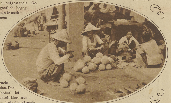
Kokosnußhändler auf dem Markte