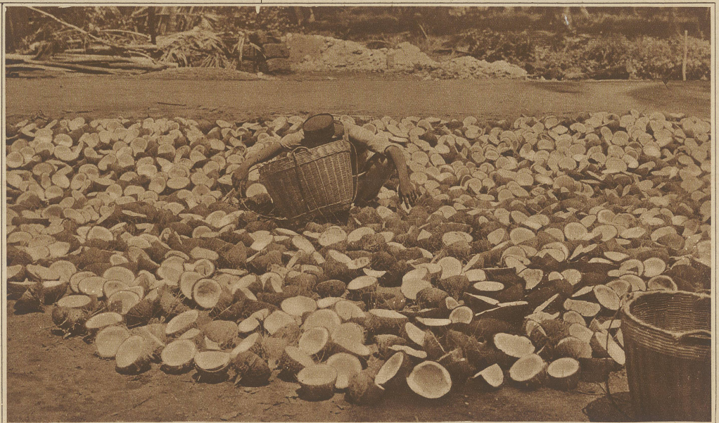
Trocknen aufgeschlagener Kokosnüsse

den sich in chinesischen Händen. Die Chinesen sind hier sehr zahlreich vertreten und meist mit Moro- oder Philippinofrauen verheiratet. Ich sah nur vier chinesische Frauen. Das Hauptprodukt bilden Perlmuttereschalen und Kopra. Die Moros verkaufen an die Chinesen die ganzen Kokosnüsse, während die Chinesen durch Aufschlagen der Nüsse die weitere Verarbeitung zu Kopra vornehmen. Auch ein eigenartiger schwarzer Fisch, Jisi genannt, bildet einen ziemlich großen Handelsartikel. Dieser etwa 1-1½ Hand lange Fisch schwimmt dicht unter der Oberfläche des Wassers und kann darum von den Moros leicht gefangen werden. Die Moros verkaufen ihm an die Chinesen, die ihn trocknen und räuchern, um ihn in diesem Zustand entweder nach China zu exportieren oder wieder bei den Moros gegen andere Artikel auszutauschen. 75% des ganzen Geschäftes in Jolo liegen in chinesischen Händen. Die Chinesen, die hier von den Moros alle Arten von Fischerei- und Agrikulturprodukten etwa 150% unter Preis kaufen, machen recht gute Geschäfte und werden in verhältnismäßig kurzer Zeit wohlhabend. Von der amerikanischen Regierung wird für eine Reihe von Jahren unter den Noblen der Moros ein Sultan und ein Premierminister gewählt. Der Sultan hat das Recht, Befehle und Erlasse für seine Stammesgenossen zu erteilen, Gerichte abzuhalten und kleine Strafen zu verhängen. Im allgemeinen fürchten die Moros diesen Sultan außerordentlich und fügen sich seinen Erlässen.