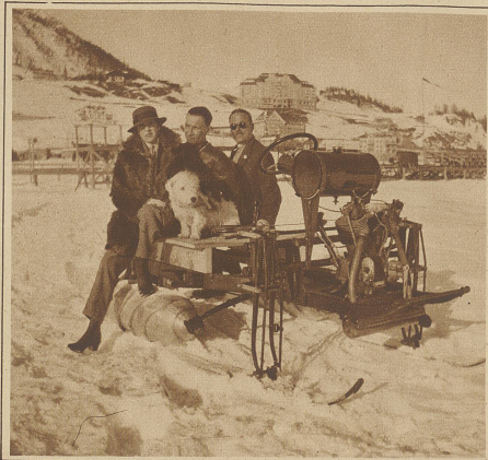
Eine Vergnügungsfahrt auf dem St. Moritzersee

Der Schneemotor. Im Verlaufe des letzten Winters und den vergangenen Sommer über wurden in St. Moritz, Andermatt und im Jungfraugebiet die ersten erfolgreichen Versuchsfahrten mit einem neuartig konstruierten Schneemotor unternommen, der sich als Verkehrs- und Beförderungsmittel bei ungünstigsten Wegverhältnissen außerordentlich gut bewährte. Zwei mit Zügen versehene, rotierende Aluminium-Cylindern dienen als Antrieb. Auf diese Weise können Geschwindigkeiten bis zu 50 km in der Stunde erreicht werden. Interessant sind die gegenwärtig aufgestellten Versuche, diese neue Konstruktion für besondere Zwecke auf gewöhnliche Automobile aufzumontieren zu können, derart, daß die Vorderräder durch Schlittkufen und die hinteren Räder durch die rotierenden Zylinder ersetzt werden