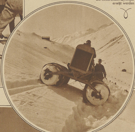
Versuchsfahrt auf der eingeschneiten Gotthardstraße