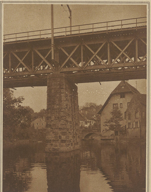
Die Eisenbahnbrücke bei Aargau