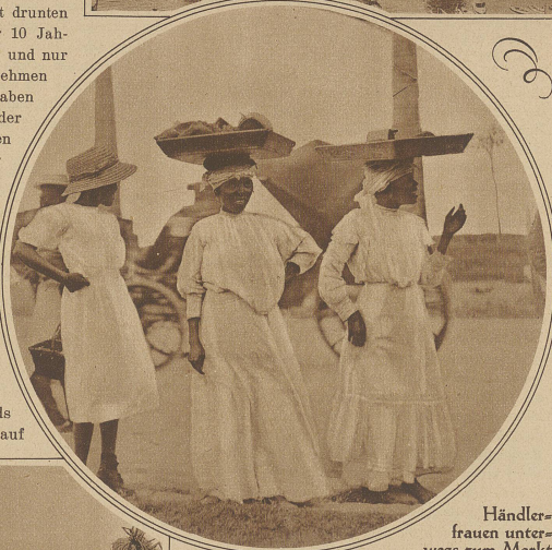
Händlerfrauen unterwegs zum Markt

So ungefähr sah Havanna vor der furchterlichen Sturmkatastrophe aus, die vorige Woche das fruchtbare Inselreich heimsuchte. 650 Menschen fielen dem Wirbelsturm zum Opfer. Weitere 3000 Personen wurden verwundet, darunter 500 schwer. Hunderte von Fischerboten wurden auf die Küste geschleudert, wo sie zerschellten. Infolge der Zerstörungen der Häuser von Havanna sind 3200 Familien obdachlos geworden. Der größte Teil der Stadt steht unter Wasser. Die meisten der im Zerstörungsgebiet gelegenen Zuckerplantagen sind vernichtet. Der gesamte Schaden dürfte annähernd eine Milliarde Franken erreichen.