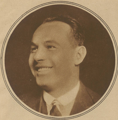
Jan Kiepura, dessen sensationelle Gastspiele an der Wiener und Berliner Oper ihm den schmeichelhaften Titel des Nachfolgers von Caruso eingetragen haben. Kiepura ist polnischer Student