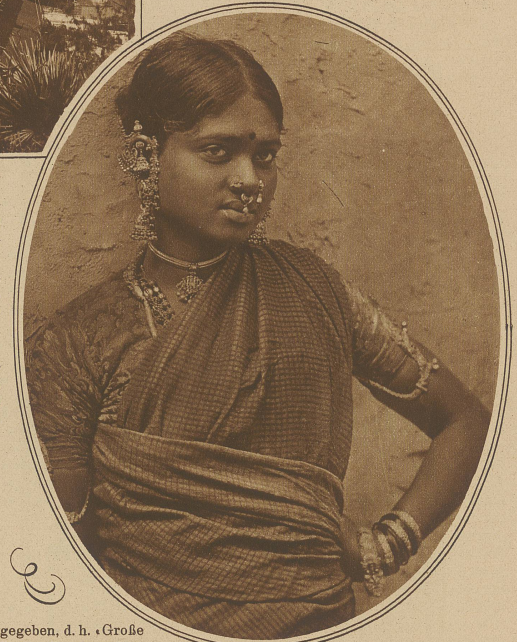
Ceylonessin mit reichem Goldschmuck

puten und Pendschabstämme, sich zweifelsohne gern der englandfeindlichen Bewegung anschließen würden. Das niedere Hinduvolk, die große Masse, ist indolent. Das Haupt der politischen Opposition in Indien ist Ghandi, einer der merkwürdigsten politischen Heiligen unserer Tage. Von seinen Anhängern wird ihm der Ehrenname »Mahatma«