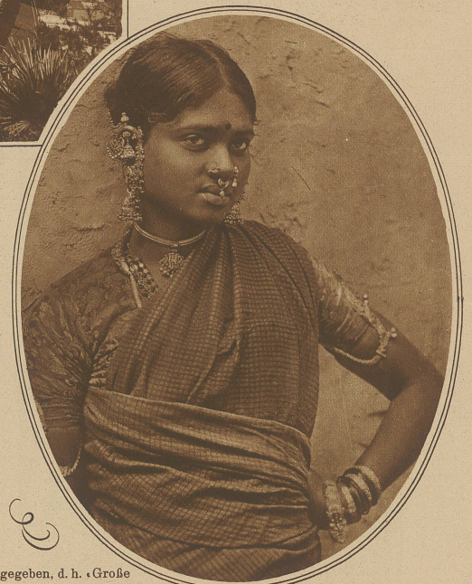
Ceylonessin mit reichem Goldschmuck

Das Haupt der politischen Opposition in Indien ist Ghandi, einer der merkwürdigsten politischen Heiligen unserer Tage. Von seinen Anhängern wird ihm der Ehrenname »Mahatma«