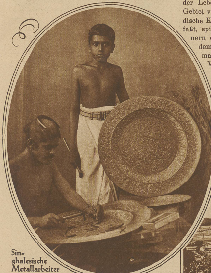
Singhalesische Metallarbeiter bei der Verfertigung prächtiger handgetriebener Messingplatten

Indien ist kein einheitliches Land, seine Völker im Norden und Süden weisen die größten Verschiedenheiten auf, sie sind im ganzen durch die beiden großen Religionsbekenntnisse, des