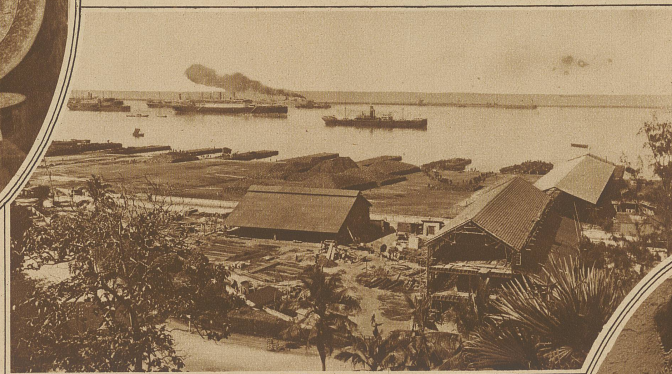
Blick auf den Hafen von Colombo

Golf. Portugals Vernachlässigung seiner indischen Interessen, die eine Folge der Vereinigung Portugals mit Spanien im Jahre 1580 war, brachte zuerst die Engländer, dann die Holländer und Franzosen als Konkurrenten nach Indien, und bis auf wenige Plätze gingen die portugiesischen Besitzungen sehr bald verloren. Indien wurde 1858 nach Niederwerfung des Aufstands mit dem Britischen Reiche als Kaiserreich Indien vereinigt. Die Königin Victoria von England nahm den Titel Kaiser-i-Hind an. Zwar wurde an die Spitze des Landes als Vertreter der Kaiserin ein sogenannter Vizekönig gestellt, dem ein Generalrat von sechs Mitgliedern zur Seite steht. Die wirkliche Regierung des Landes ruht jedoch in London in den Händen des Staatssekretärs des India-Office, dem ebenfalls ein Rat und zwar aus Europäern und Indern, indes nur mit beratender Stimme, zur Seite steht. London