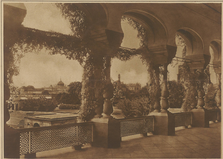
Im Palast von Lurknou

Brahmanismus und des Buddhismus weit von einander getrennt und zerfallen in unzählige Kasten. Diese Gegensätze sind es, die es den Engländern ermöglicht haben, Indien mit einer Handvoll weißer Beamter in Schach zu halten. Das Wunderland Indien, wie man es so häufig mit Recht nennt, ist noch nicht verschwunden. Noch stehen seine herrlichen Bauten aus der Zeit der Großmoguln, noch blühen seine merkwürdigen Kultstätten, die Ziele von Millionen von Pilgern. Die mehr oder minder von europäischer Bildung durchtränkten Indier empfinden das fremde Joch, unter dem sie stehen. Die Masse des indischen Volkes, arm und in Unwissenheit dahinleidend, geknebelt durch Religions-satzungen und Kastenvorschriften, erwacht ganz allmählich zu der Sehnsucht, nicht von Fremden, sondern von Führern aus dem eigenen Volkstum regiert zu werden.