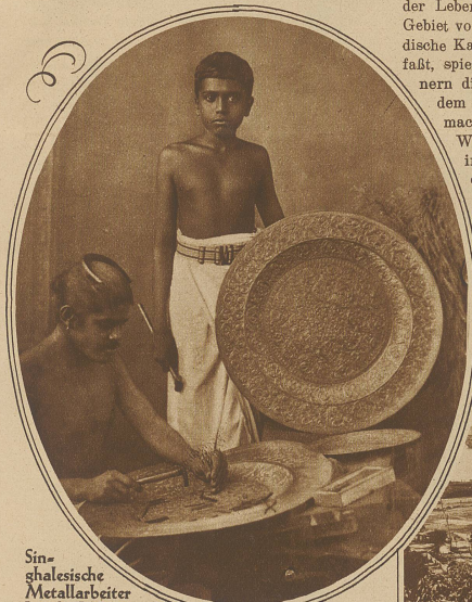
Singhalesische Metallarbeiter bei der Verfertigung prächtiger handgetriebener Messingplatten

Indien ist kein einheitliches Land, seine Völker im Norden und Süden weisen die größten Verschiedenheiten auf, sie sind im ganzen durch die beiden großen Religionsbekenntnisse, des