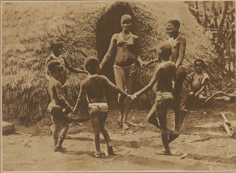
Ringelreihen-Festanz vor der Hütte