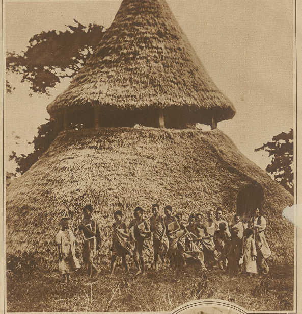
Eine Negerkinder-Schule verläßt das Schulhaus