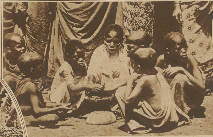
Guten Appetit! ..

die des weißen Mannes beginnt. Das intensive Leben der Jugend, die Jahre der Sorglosigkeit und Sonne sind vorbei, wenn