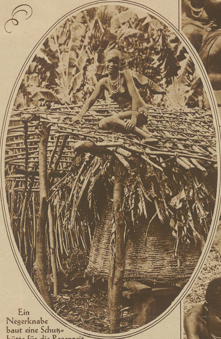
Ein Negerknabe baut eine Schutzhütte für die Regenzeit

wie das unsere, und die Anspruchslosigkeit der Primitivität, die ihnen erhalten blieb, sichert ihnen ein Glücksgefühl, das wir erst immer von neuem auf mühseligen Umwegen über die Philosophie erringen müssen. Wer es gut mit ihnen meint, wünscht, daß ihnen die Segnungen europäischer Zivilisation noch für recht lange Zeit versagt bleiben mögen.