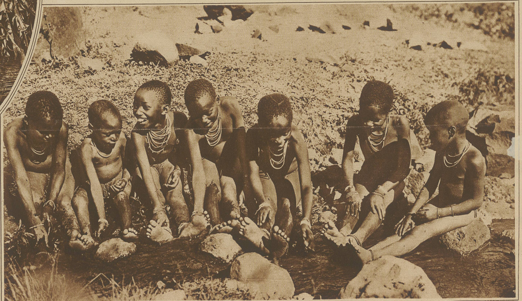
Badende Kinder am Bache

ins Gesicht zu spritzen. Jetzt beginnt das Negerkind eine Persönlichkeit zu werden. Es muß sich bald die Nahrung selbst verdienen und lebt fast vollkommen selbständig. Die Kinder bilden eine Klasse für sich, fast gleichberechtigt den Aelteren. Wenn sie das geliebte Bao spielen, stehen die Alten interessiert um sie herum, als handle es sich um eine Schachpartie. Die Kleinen haben oft ihre eigene Sprache, ja fast ihre eigene Kultur. In ihren Händen liegt z. B. das Flötenspiel. Sie schneiden selbst die Instrumente, erfinden und überliefern die Melodien und geben den Jüngeren Unterricht. Ihr ganzes Leben ist eine Summe von Produktivität und Freiheit: bis zum Unyago