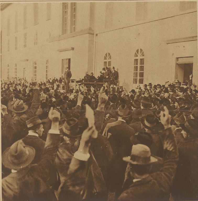
Die Bezirksgemeinde von Einsiedeln stimmt der Konzessionserteilung für den Bau des Sihlsees mit bedeutendem Handmehr zu.