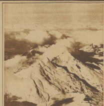
Auf der Scheidegg steht die bekannte Jungfernhütte. Von dort aus ist ein weiterer Blick vom Jungfernhorn auf Lauterbrunn und Tschuggen.