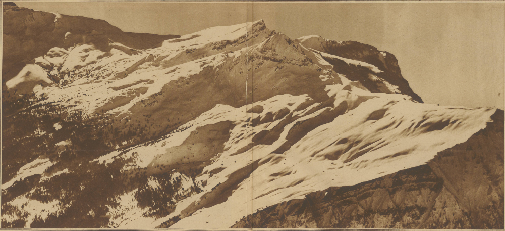
Dieses große Überblicksbild hat Walter Mittelholzer aufgenommen, um zu zeigen, daß die Kleine Scheidegg der Ausgangspunkt für die berühmten Crestabfahrten der Mannlicherkette ist. Man schreitet von der Haas am Hange der Tschuggen hinunter gegen den Mänlichfer und hat dabei die Wahl zwischen mehreren wunderbaren Abfahrten, die sämtlich auf der großen Höhe der Bergstämme liegen. (Lauberhorn-Tschuggen-Mänlichfer haben eine Durchschnittshöhe von ca. 2450 m) und bei Crindelwald auf weniger als 1000 m enden, so daß man im abwärtsgerichtetem Gelände, das so gilt und bei teilweisem Schnee (Niederschnee) mit einem Ausblick auf die wilden Kelche der Täler Schindler und Wetterstein (siehe herrliche Abfahrten) sprechen kann. Sporttage führen zurück nach Alpnach, innerhalb der Scheidegg oder man wählt für die Rückfahrt den Talweg über Lauterbrunn und Wengen (guter Abstieg bei Scheidegg).