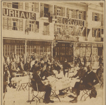
In der Höhe verweilt sich täglich ein lebliches Leben. Dieser Bazarrennenbereich am Centralplatz ist ganz, verspielt und höchst behaglich.