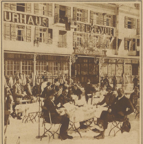
In der Höhe verweilt sich täglich ein lebliches Leben. Dieser Bazarrennenbereich am Centralplatz ist ganz einfach und höchst behaglich.