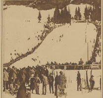
Die Höhe der großen Sporttage bringt es mit sich, daß der gut Scheidegg Anstiege mehrere herrliche Anstiege von Wengen aus. Centralplatz zwischen Kisten.