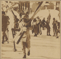
Geplätt kann aufgegeben werden. In diesem Jahre Schindler, Blick von Haas auf den Bahnhöf.