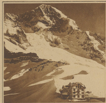
Blick gegen Engelrieder und Mänlich. Die Gerüste der Jungfernhütte zeigen von der Scheidegg aus und erheben die 200 m. Pflanzung zum Engelrieder.