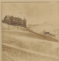
Das haben die Anstiege vollbracht! Sie verziehen sich ganz hinter die Haas, um auf dem sonnigen, warmen Talhang die Langlauf mit ihrem Gerät zu erlernen.