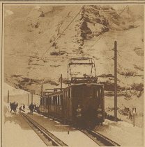
Täglich sechs Anfahrten von Wengen hinauf. Die schönsten Aussichten der Wengengebirge eröffneten Sie von der Haas.