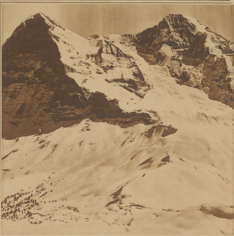
Die Hotels stehen inmitten des allerbesten Skistandes. Besonders beliebt sind die rund um die Haas legenden Liebesfelder, wo man unter Anleitung bewährter Skiführer in kurzer Zeit die nötige Liebung erlangt, um weiter in das herrliche Skigebiet vorzudringen.