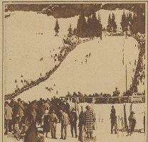
Die Höhe, der großen Sportplätze bietet es mit sich, daß der auf Scheidegg Anstiege verweilt sich täglich einige Verweilzeiten von Wengen aus. Centralplatz zwischen Haas.