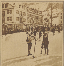
Blick vom Bahnhöf auf die Haas, von in gebührender Ferne oder im Finstern. Sonnenschein jedermann zum Inhalt willkommen ist.