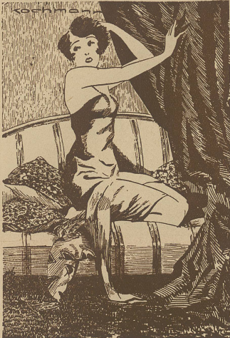
Geschäft ist Geschäft

Film-Star (im Selbstgespräch): «Mein Anwalt will meine erste Scheidung kostenlos durchführen, wenn ich verspreche, ihm auch alle anderen Scheidungsklagen zu übergeben.»