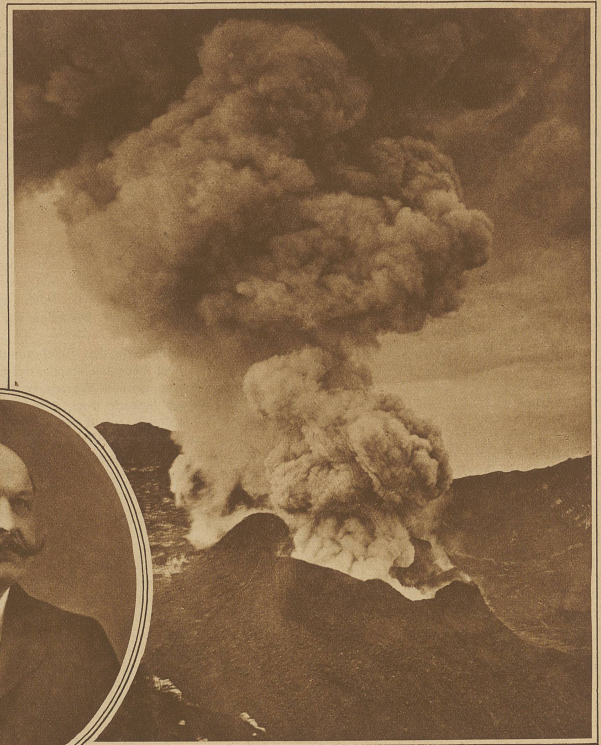
Momentbild starker Eruption während des neuesten Ausbruchs des Vesuvus