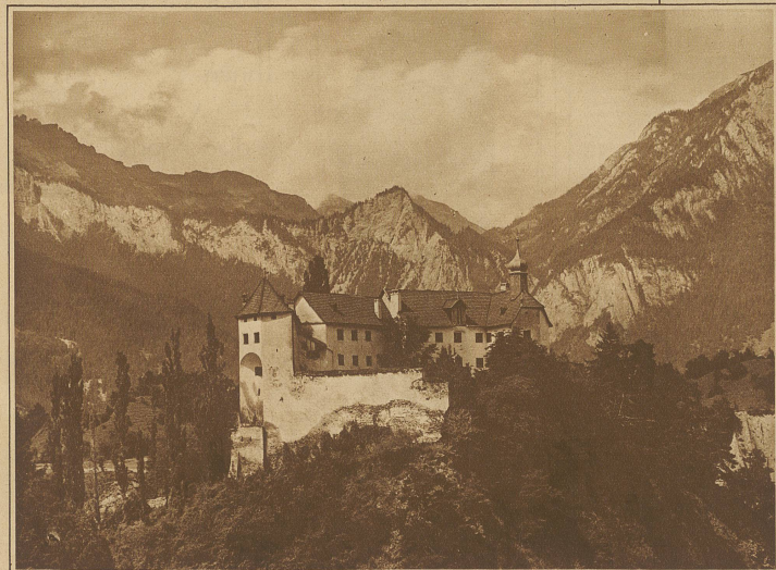
Schloß Rhäzüns, eines der schönsten Schweizer Schlösser, ist von einer Genossenschaft der Auslandschweizer-Organisation der Neuen Helvetischen Gesellschaft angekauft worden und soll nach vollzogenen Renovationsarbeiten durch Architekt Probst vom nächsten Frühjahr an als Ferienheim für Auslandschweizer dienen