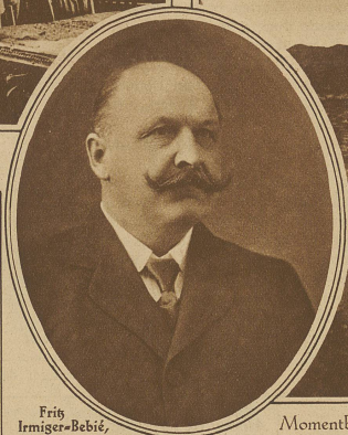
Fris Irmiger-Bebé, alt Oberzolldirektor, ist letzte Woche in Bern an den Folgen eines Schlaganfalles gestorben