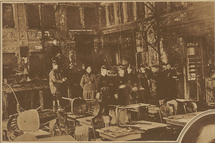
Theaterbrand in Rom. Das prächtige Apollotheater fiel einer großen Brandkatastrophe zum Opfer, wobei vier in ihren Kabinen sich aufhaltende Künstlerinnen den Erstickungstod fanden