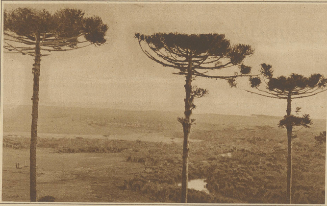
Auf den weiten Ebenen des brasilianischen Hochlandes. Im Vordergrund 3 typische abgeflachte Pinien

hen sie jetzt tiefer als Angehörige vieler afrikanischer Negerstämme.