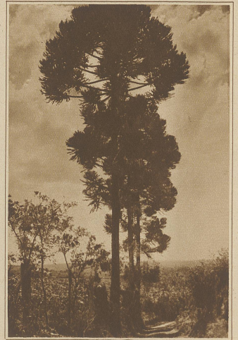
Eine Gruppe prächtiger Pinien

Nach stundenlanger halsbrecherischer Fahrt