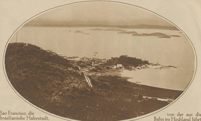
Sao Francisco, die brasilianische Hafenstadt,

mir meistens ein ganz besonders schönes Pferd, dessen Vorzüge in den lockendsten Farben gemalt werden, angeboten wird, sodaß ich mich stets frühzeitig in das erste und einzige Stockwerk zurückziehe. Die Zimmer sind durch Wände und Decken von kaum fingerdicken Brettern abgetrennt, aber von der Decke meines Gemaches haben sich zwei Planken gelöst, sind herabgefallen, sodaß ich von meinem schwunglosen, knisternden Maisstrohsack, den abends und nachts die Mosquitos in hohen langweiligen Diskantönen umsingen, bis in die Spitze des Giebelwinkels sehen kann, wenn ich von