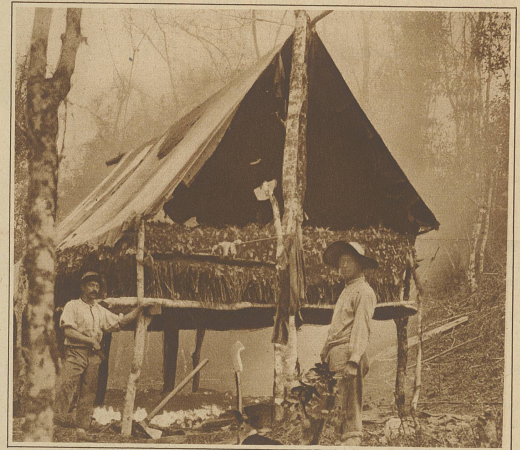
Eine primitive Matte-Teetrocknerei im Walde des Hochlandes

Was für ein Tier! Hier sind Kraft, starke Waffen und Schnelligkeit miteinander vereint. Der schlanke, abgeplattete Rumpf mit spitzem Bug und Kopf und starken, schützenden Bor-