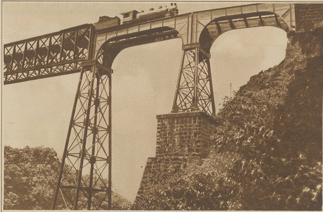
Ein Viadukt im brasilianischen Hochland

ein großes Schild: E prohibido entrar armado nestas salas» (Es ist verboten, bewaffnet diese Räume zu betreten). Selbstverständlich kehrt sich niemand von den Troperos, die in weit überwiegender Mehrzahl die Gäste sind, an dieses Verbot. Sie sind auf langen Reisen zu Pferd durch das weite Land, bringen Rudel von Gäulen aus dem Innern in die Küstenstädte herab zum Verkauf und machen hier einen halben Tag und eine Nacht lang Rast. Schnige, braun verbrannte Kerle mit schwarzen Augen unter den breiten Krempe der riesigen Filzhüte.