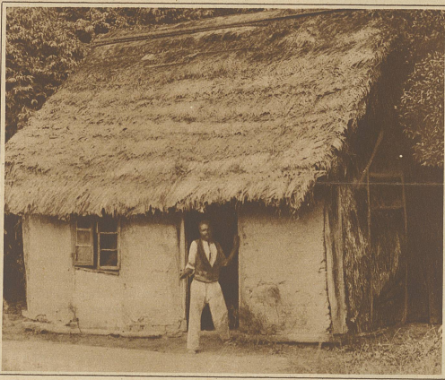
Indianer vor seiner Hütte. Die Wände des primitiven Baues bestehen ausschließlich aus Lehm, während das schwingende Dach aus geflochtenen Palmblättern verfertigt wird

Statt diesem Baume die möglichste Schonung angedeihen zu lassen, ihn zu pflanzen, zu pflegen und alles zu tun, um ihn zu verbreiten, wird eine böse Raubwirtschaft getrieben. Jedoch die Natur hat der Pinie einen seitensamen Heger beigelegt. Es ist ein Vogel, die Hochlandskrähe, von der Größe eines Stares und mit schönem, dunkelbraunem Gefieder. Zankend, lärmend treiben sie sich in den Kronen der Pinien umher, sind fuchschlau, und ihre ruhelosen, blanken Jett-Augen beobachten alles, was um sie herum vorgeht.erspähnen sie einen Menschen, so erheben sie ein wütendes, keifendes Geschrei. In der Reifezeit sind sie bemüht, große Schätze von Pinienfrüchten zu sammeln, lesen hierbei die größten und gesundesten aus und vergraben jede einzeln in der Erde. Von dem verborgenen