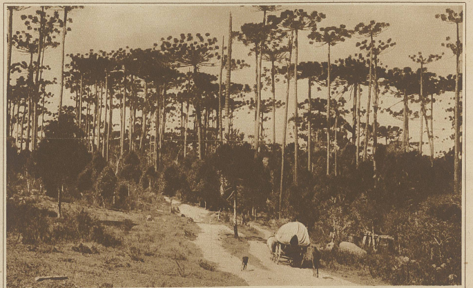
Typischer Pinienwald auf 3000 m Höhe

Am frühen Morgen, als wir zur Jagd auf Wildschweine aufbrechen, dampfte der Wald vor Nässe. Da die Caboclos, die als Treiber und Jäger mitgehen sollten, nicht zur Stelle sind, so bleibt uns nichts anderes übrig, als zu ihren Ranchos, die im Umkreise von einigen hundert Schritten um unser Wohnhaus liegen, zu gehen, um sie zu holen. Ihre Ranchos sind primitivste menschliche Bauten. Ein Holzgerüst aus dünnen Stämmen, mit Lehm verschmiert, nur mannshoch vom Boden; ein schmaler Eingang mit einer alten Kuhhaut verhängt, am Giebel ein kleines Loch als Fenster und das Dach mit Gras gedeckt. Herum um die Hütte sieht das Auge nur Gestrüpp und Buschwerk, nicht ein-