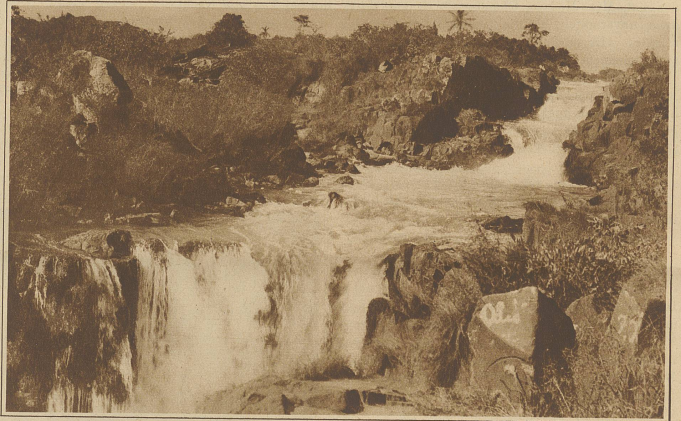
Eine der vielen Stromschnellen, die die meisten Flüsse im Landesinnern unschiffbar machen

Plötzlich nähert sich das Klaffen der Hunde, ich vernehme das Geschrei der Caboclos und gleich darauf auch gewahre ich, im Zehntel einer Sekunde, die dunklen Gestalten zweier Wildschweine unweit von uns über die Lichtung jagen. Wir schießen fast gleichzeitig. —