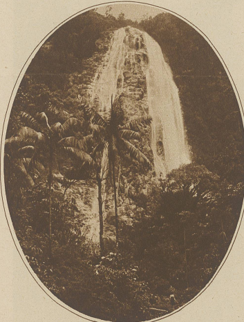
Ein Wasserfall im Innern des brasilianischen Hochlandes