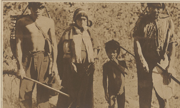
Eine Familie Eingeborener, die bereits mit der Zivilisation in Berührung gekommen ist

meiner abendlichen Lektüre für kurze Zeit abblinke. Ich lese die mir von einem hier heimisch gewordenen Schweizer angebotene «Zürcher Ill-