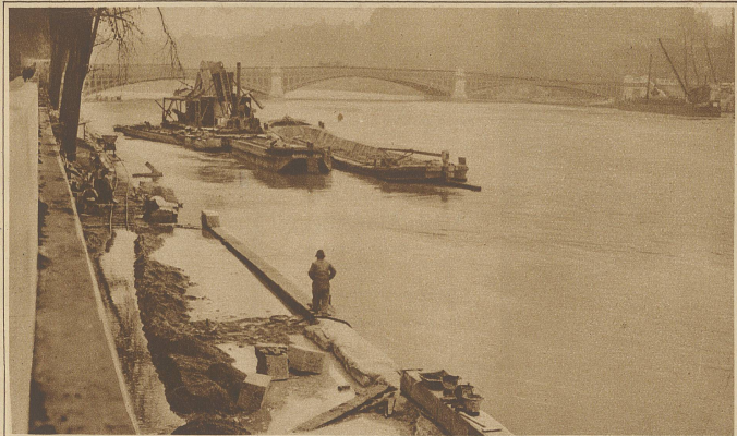
Hochwasser in Paris. Die Ueberschwemmung am Quai der Tuileries