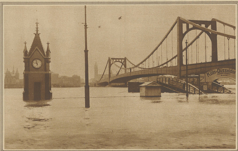
Blick auf das überschwemmte Köln