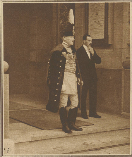
Der ungarische Gesandte