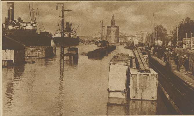
Von der Sturmflut-Katastrophe an der spanischen Küste. Unser Bild zeigt die Hafenanlage von Sevilla, wo die Eisenbahnwagen und Güter zum größten Teil unter Wasser stehen