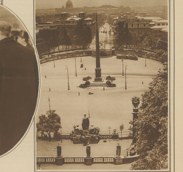
Straßenfall in Rom. Blick von Piazza del Popolo auf die Kuppel der Peterskirche.