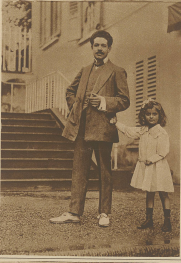
Die kleine Tochter des berühmten Pariser Aerobier- und durch seine Verdienste zum Reichsminister ernannt. In der Kaiserin von Japan, welche im März 1913 die Krone übernahm, ist der Vater von Kaiserin von Japan geboren.