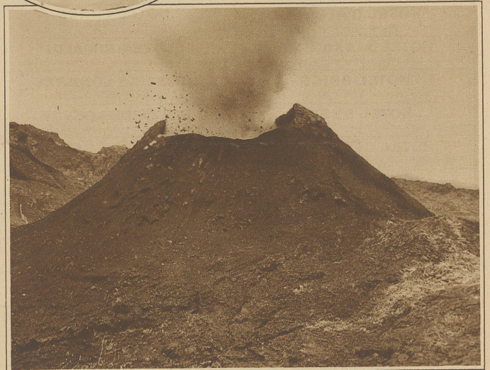
Ein Momentbild vom neuen Ausbruch des Vesuv. Der im alten Krater entstandene Feuerschlund in voller Tätigkeit