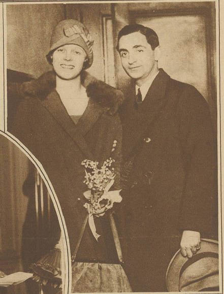
Millionärstochter und Jazzkönigs, Ellen Mackay, die Tochter des amerikanischen Millionärs Clarens Mackay, Inhaber der Atlantic-Cable-Compagnie, hat sich mit dem Jazzkomponisten Irving Berlin verheiratet. Herr Mackay hat daraufhin seine Tochter enterbt

Letzten Montag wurden die Bewohner von Mohabit kurz vor 7 Uhr durch eine überaus heftige Detonation mit darauffolgender Erschütterung aus dem Schlafe geweckt. Die Fensterscheiben der in der Kirchstraße liegenden Wohnhäuser wurden fast ausnahmslos zertrümmert. Nur notdürftig gekleidet verließen die erschreckten Bewohner die Häuser. Wie sich herausstellte, explodierte das Benzinmagazin einer Seifenverwertungsfabrik durch Selbstentzündung. Unser Bild zeigt ein im Moment der Explosion vorbeifahrendes Automobil, welches durch die Gewalt der Explosion auf die gegenüberliegende Straßenseite geschleudert wurde. Zwei Passagiere fanden dabei den Tod